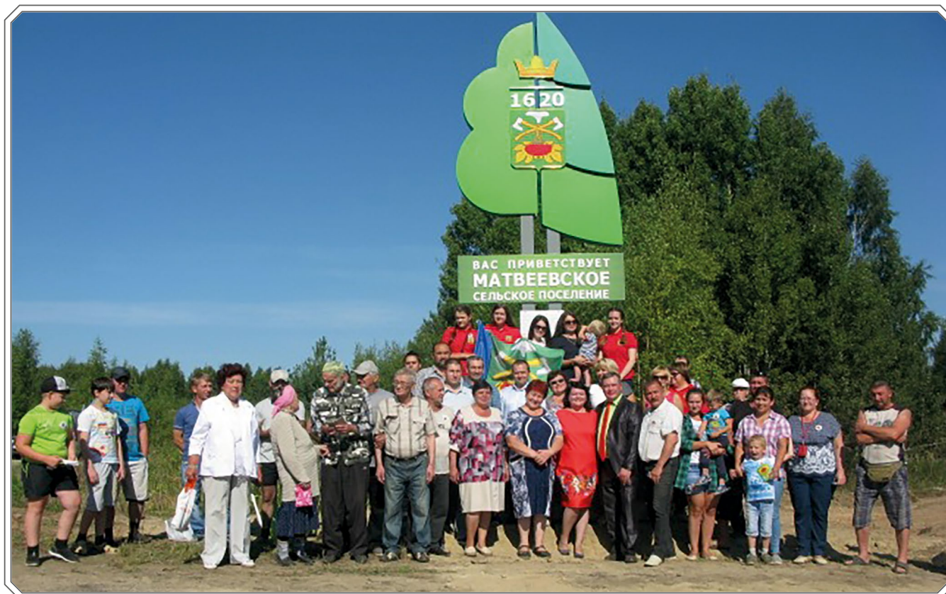
Матвеевское сельское поселение. Стела на въезде. 2020 год.