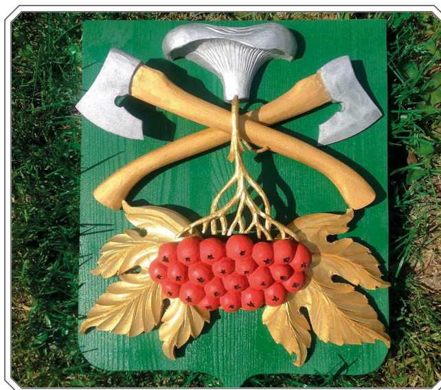
Герб, выполненный из дерева. 2020 год.