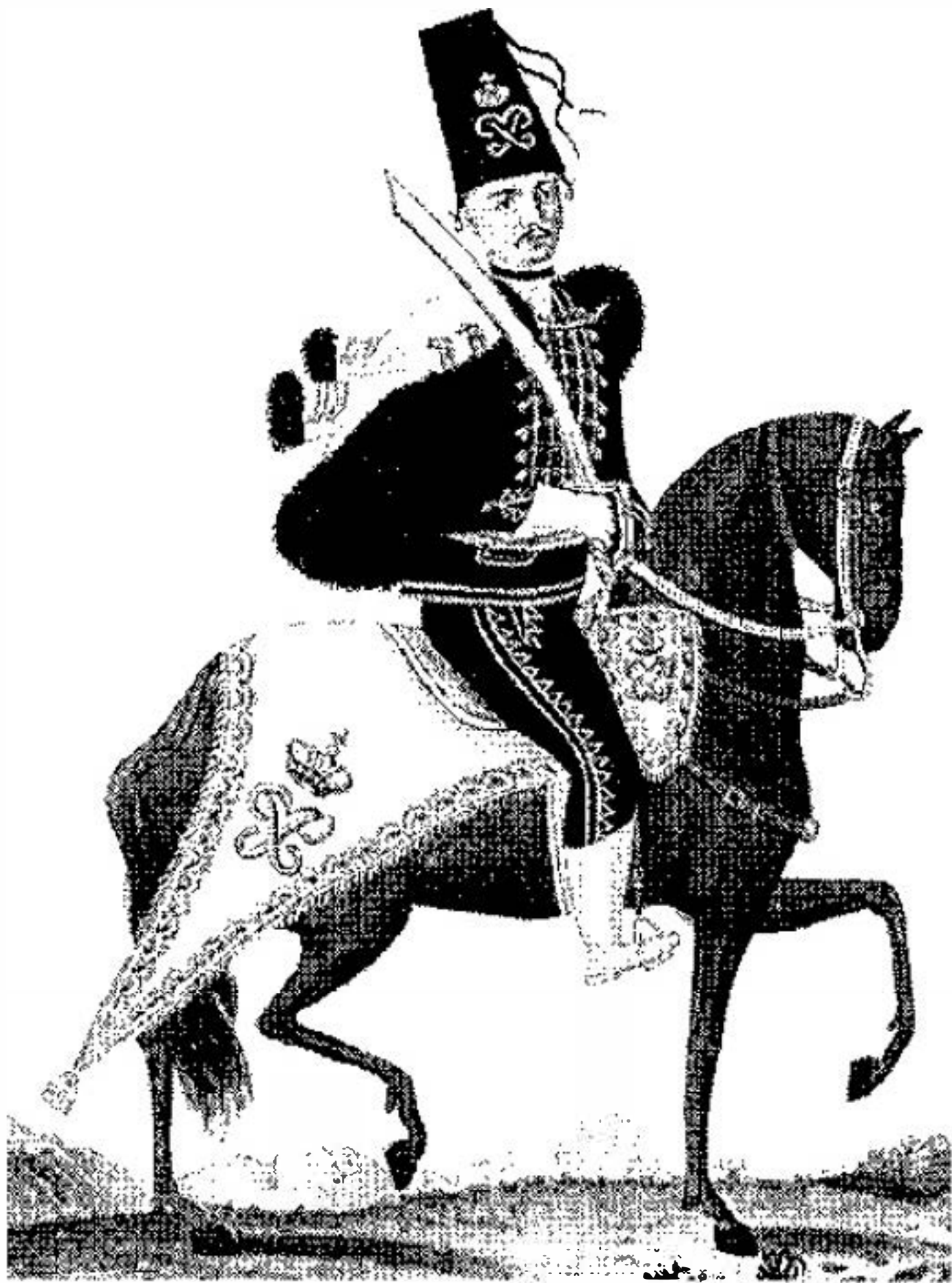
Офицер гусарского полка фон Цобельгитца. 1762. Раскрашенная литография 1820-х гг. Собрание ГЭ

за комплектом (поэтому их в будущем и хватило на все музеи и частные коллекции). А собственно лейб-драгунских гренадерок из белого и селадонового сукна не сохранилось, по-видимому, ни одной. То же относится и к офицерским патронным сумам из белого сукна с золотой выпивкой – это не лейб-драгунские вещи, а принадлежности экипировки гренадерского батальона, впоследствии – пехотного полка бригадира фон Цоймерна.