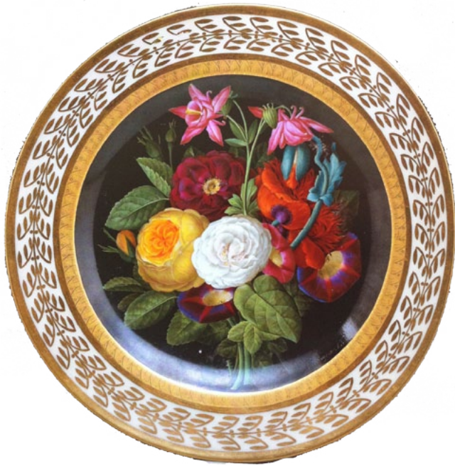
Э. Сагер. Тарелка с букетом цветов Королевская фарфоровая мануфактура, Берлин. 1817 год Й. Нигг. Ваза с цветами в форме кратера. Вена. 1828 год