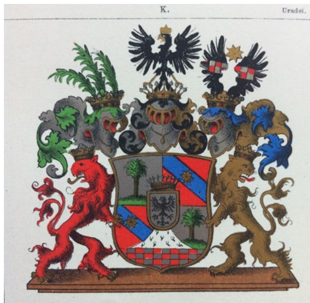
Герб графов фон Кейзерлинг (прусская ветвь) из гербовника К. А. Клингспора

ков известен главным образом как сын Вильгельма Иоахима Рейнхольда фон Кроков (1767–1821) — военного деятеля периода наполеоновских войн, создателя добровольческих корпусов во время предпринимавшейся пруссаками в 1807 году в союзе с Россией обороны Данцига от французов. Карл Густав Адольф фон Кроков занял видное место в истории своего края и как организатор перестройки старинного родового замка Крокова, сохранившегося до наших дней в Померанском воеводстве Польши и приобретшего именно при нем свой нынешний облик. В этом же замке, скорее всего, и произошло торжество, объединившее две почтеннейшие фамилии Прусского королевства. Возможно, именно для этой резиденции и предназначались парные геральдические вазы. Однако альянс двух графских родов оказался недолговечен: новоявленная графиня фон Кроков, которая была почти вдвое моложе своего мужа, всего через год после свадьбы, 13 июня 1845 года, умерла при неудачных родах, не оставив потомства 8 .