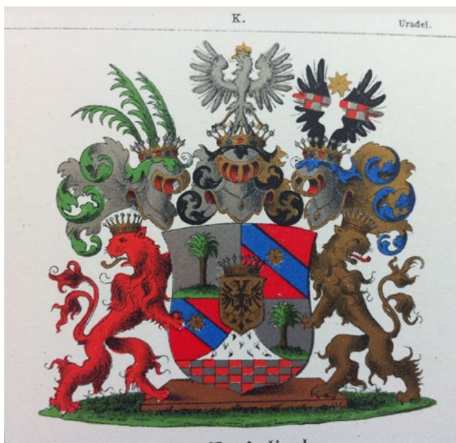
Герб графов фон Кейзерлинг (остзейская ветвь) из гербовника К. А. Клингспора