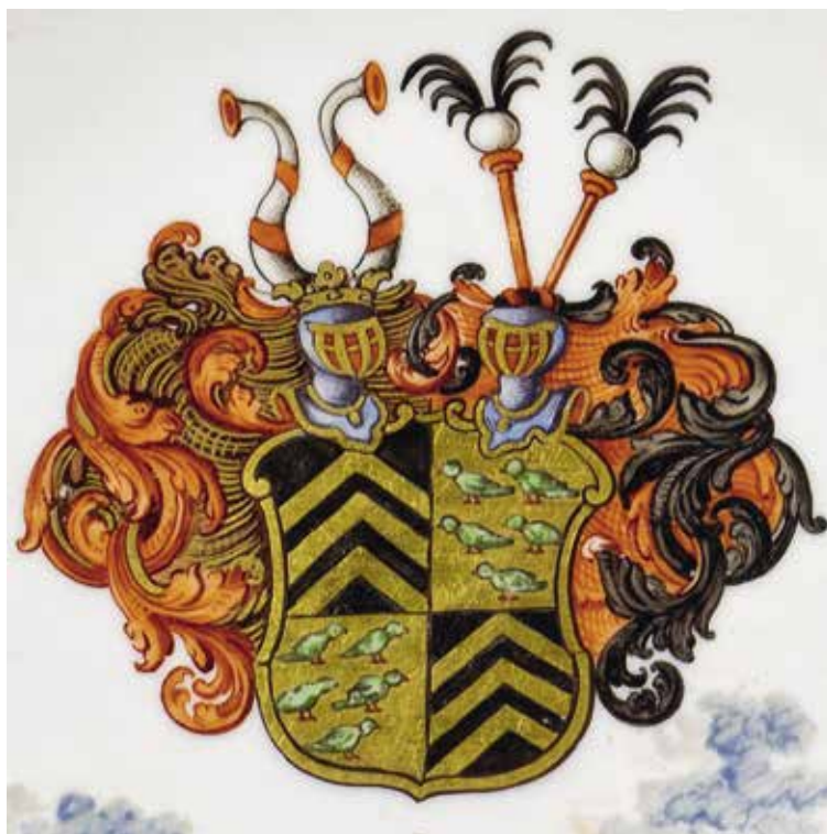
Ил. 4. Герб на сервизе