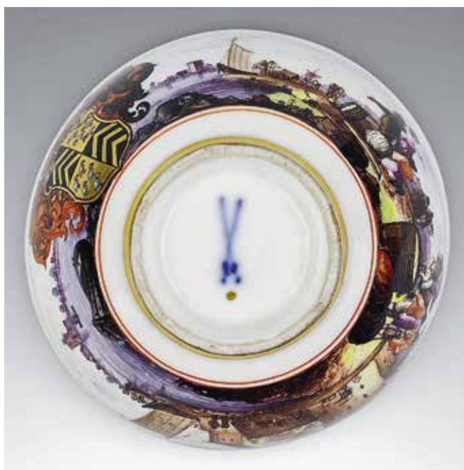
Ил. 2. Марка подглазурная «синие скрещенные мечи» на тарелке сервиза