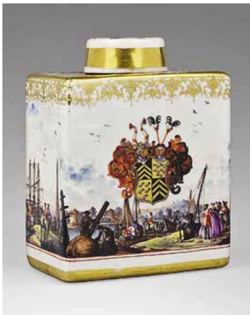
Ил. 3. Чайница с гербом