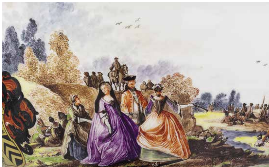
Ил. 5. Сцена в гавани

сценках с группами из нескольких персон на фоне гавани или городских укреплений. Подобные композиции мы можем наблюдать на данном сервизе с гербом баронов Берлепш. Сервиз, расписанный в стиле Хайнце, экспонируется на постоянной выставке фарфора в Зимнем дворце Государственного Эрмитажа в зале № 305.