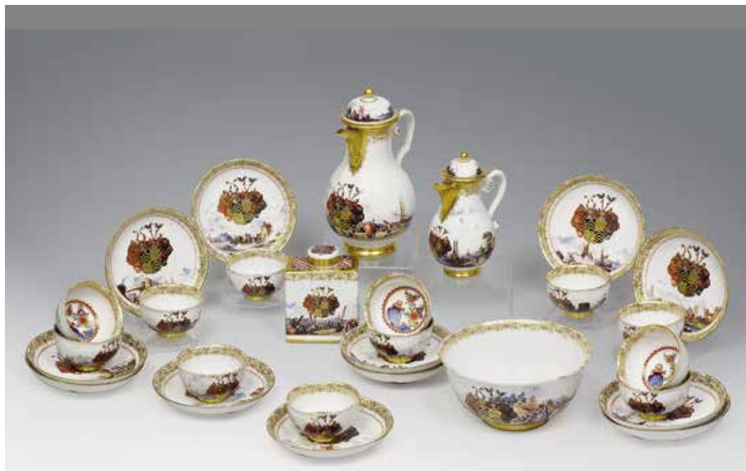
Ил. 1. Сервиз с гербом баронов Берлепш. Общий вид. Мейсенская мануфактура. 1735–1745. Галерея «Антик-палас» (Москва)