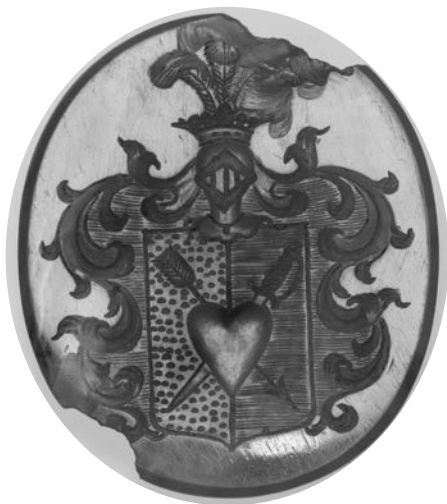
Ил. 13. Печать с гербом рода Денисьевых. Сердолик. 2,9 × 2,5 см. Инв. № И12206. Государственный Эрмитаж