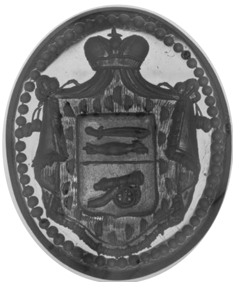
Ил. 18. Печать с гербом рода Ерошкиных. Сердолик. 2,6 × 2,1 см. Инв. № И12066. Государственный Эрмитаж