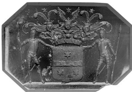
Ил. 9. П. Е. Доброхотов. Печать с гербом баронов Вревских. Сердолик. 1,5 × 2,3 см. Инв. № И12269. Государственный Эрмитаж