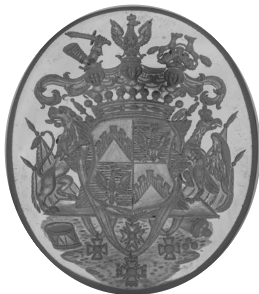
Ил. 6. Печать графа Ф. Ф. Буксгевдена. Халцедон. 3,8 × 3,2 см. Инв. № И11696. Государственный Эрмитаж

О роде Вагнер, иудейского происхождения, опубликован материал С. Н. Тройницкого в августовском номере Гербовета 1913 года 19 (с. 135–140), где приводятся тексты прошений о пожаловании герба Вагнеру с потомством, из которых следует, что Василий Вагнер, управляющий имением графа Алексея Григорьевича Разумовского, выехал в Россию из города Вамфельта с графом Семеном Андреевичем Салтыковым, жил в Москве, где в 1729 году принял крещение, и в 1745 году пожалован с детьми в российское дворянство. В резолюции 1750 года дается описание герба Вагнер: «В голубом поле плоский золотой крест в сердце щита между тремя серебряными весками. Над щитом несколько открытый к правой стороне обращенный стальной дворянский шлем с поставленным на нем голубым крылом и с повторенном на оном крыле щитовым плоским крестом. По сторонам щита опущен шлемовный намет голубого цвета, с правой стороны подложенный золотом, а с левой серебром, так как оной дворянской герб в сей нашей жалованной грамоте и самыми красками изображен» 20 (с. 139).