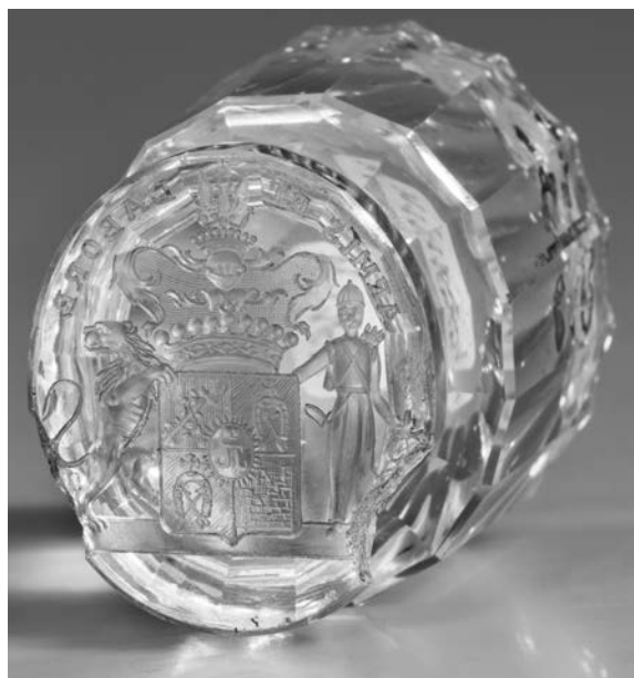
Ил. 12. Печать с гербом графа И. В. Гудовича. Горный хрусталь. 3,5 × 3,0 см, высота 5,5 см. Инв. № И11651. Государственный Эрмитаж