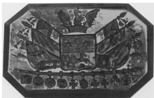
Ил. 3. Печать с гербом П. М. Безобразова. Сердолик. 1,4 × 2,1 см. Инв. № И12149. Государственный Эрмитаж