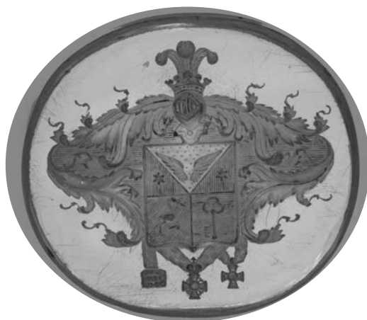
Ил. 26. Печать с гербом Ф. Д. Серапина. Горный хрусталь. Инв. № И11700. Государственный Эрмитаж