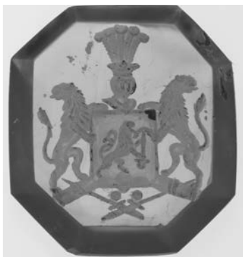
Ил. 8. Печать с гербом рода Фон Вендрих. Сердолик. 2,0 × 1,7 см. Инв. № И12245. Государственный Эрмитаж