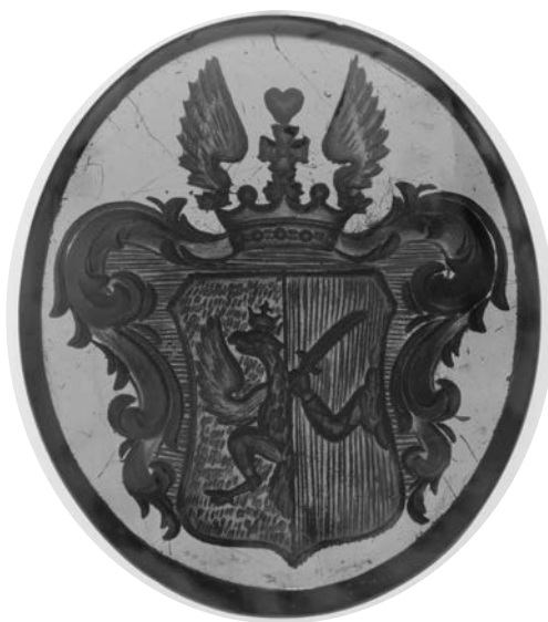
Ил. 19. Печать с гербом А. А. Жеребцова. Сердолик. 2,76 × 2,3 см. Инв. № И12048. Государственный Эрмитаж