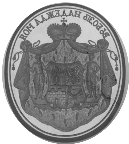
Ил. 16. Печать с гербом князей Долгоруких. Халцедон. 2,8 × 2,5 см. Инв. № И11693. Государственный Эрмитаж