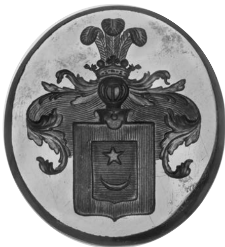
Ил. 23. Печать с гербом рода Новиковых. Агат. 2,8 × 2,5 см. Инв. № И12215. Государственный Эрмитаж