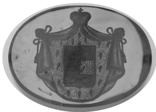
Ил. 29. Печать с гербом князей Шелешпанских. Сердолик овальный. 2,2 × 3,0 см. Инв. № И12041. Государственный Эрмитаж