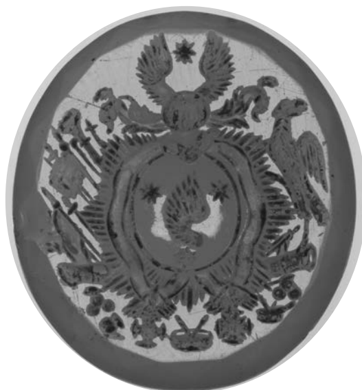
Ил. 4. Печать с гербом рода Берг. Сердолик. 1,9 × 1,7 см. Инв. № И12202. Государственный Эрмитаж