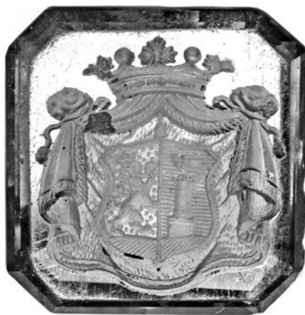
Ил. 14. Печать с гербом рода Дьяковых. Аметист. 1,5 × 1,3 см. Инв. № И12147. Государственный Эрмитаж