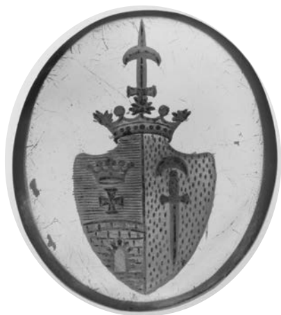
Ил. 21. Печать с гербом Львовых. Сардер. 2,5 × 2,2 см. Инв. № И12103. Государственный Эрмитаж