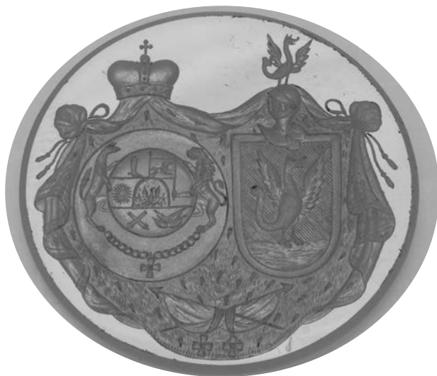
Ил. 27. Печать с соединенными гербами графа Симонича и княжны Амилахваровой. Халцедон. 3,2 × 3,5 см. Инв. № И11692. Государственный Эрмитаж