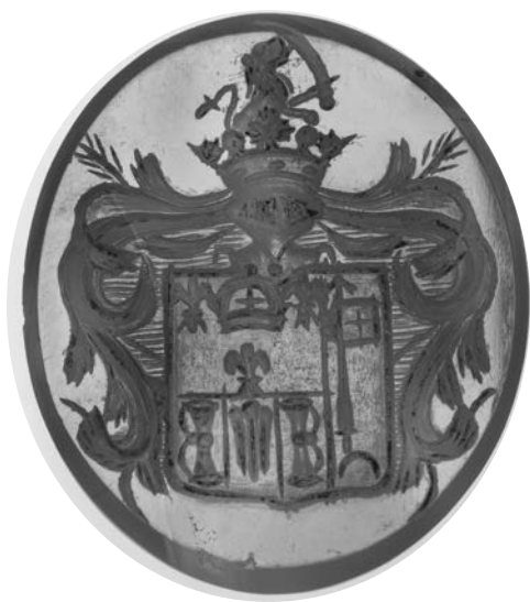
Ил. 28. Печать с гербом рода Челшцевых. Сардер. 2,8 × 2,3 см. Инв. № И12220. Государственный Эрмитаж