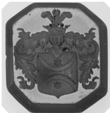
Ил. 22. Печать с гербом рода Мессинг. Сердолик. 1,4 × 1,2 см. Инв. № И12266. Государственный Эрмитаж