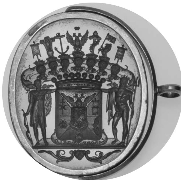
Ил. 20. П. Е. Доброхотов. Печать с гербом графа А. Г. Кушелева-Безбородко. Сердолик, золото. 3,7 × 3,1 см. Инв. № И12516, ЗВз-8957. Государственный Эрмитаж