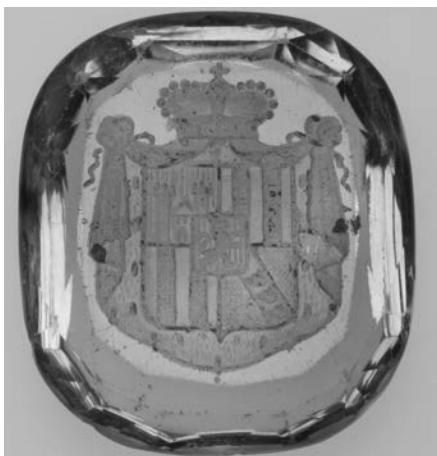
Ил. 25. Печать с гербом светлейшего князя П. Х. Сайн-Витгенштейна. Аметист. 1,8 × 1,6 см. Инв. № И12232 Государственный Эрмитаж