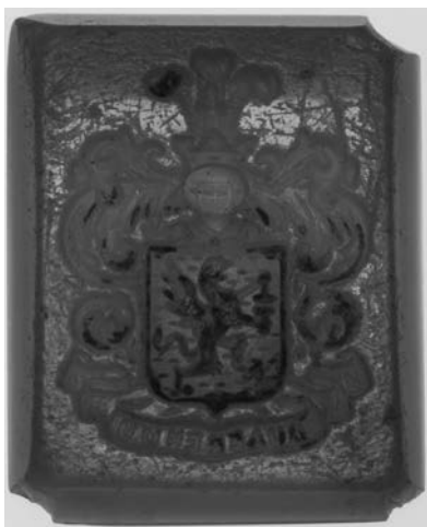
Ил. 10. Печать с гербом И. И. Глазунова. Сердолик-оникс. 1,5 × 1,2 см. Инв. № И12119. Государственный Эрмитаж