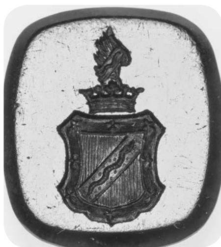
Ил. 5. Печать с гербом рода Бреверн. Яшма кровавая (геллотроп). 1,3 × 1,2 см. Инв. № И12115. Государственный Эрмитаж