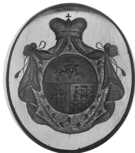
Ил. 11. Печать с гербом князей Голицыных. Сердолик. 2,9 × 2,4 см. Инв. № И12074. Государственный Эрмитаж