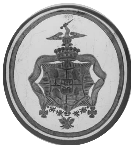
Ил. 24. Печать с гербом графа Н. П. Румянцева. Сардер. 2,7 × 2,4 см. Инв. № И12222. Государственный Эрмитаж