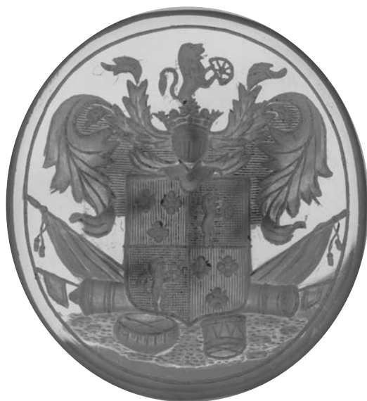
Ил. 7. Печать с гербом дворян Вагнер. Халцедон. 3,7 × 3,4 см. Инв. № И11695. Государственный Эрмитаж