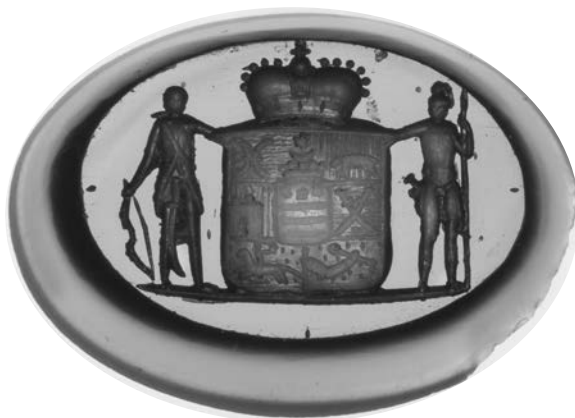
Ил. 17. Печать с гербом князей Дондуковых- Корсаковых. Сардоникс. 1,4 × 1,9 см. Инв. № И12235. Государственный Эрмитаж