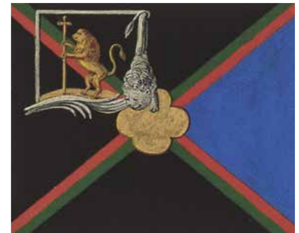
Ил. 2. Знамя 38-го Драгунского Владимирского полка 1712 года. Воспроизводится по: Историческое описание одежды и вооружения российских войск. Ч. 2. СПб., 1842. Л. 224. Государственный Эрмитаж

На лицевой стороне первой из рассматриваемых нами медалей (ил. 1) в широком ободке изображены трех овальных медальонов, окруженных лавровыми ветвями и увенчанных императорской короной. В левом верхнем медальоне портрет основателя полка – императора Петра I, обращенный вправо. В правом верхнем – императора Николая II, обращенный влево. В нижнем же – изображение шефа полка, великого князя Михаила Николаевича. По нижнему краю последнего