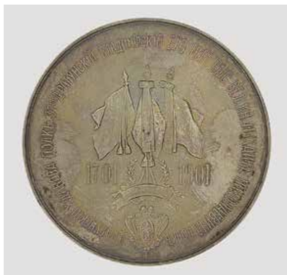
Ил. 3. Медаль в память 200-летия 38-го Драгунского Владимирского полка. А. А. Грилихес. Санкт-Петербургский монетный двор. 1901. Серебро. Диаметр 79 мм. Инв. № РМ-5240. Государственный Эрмитаж