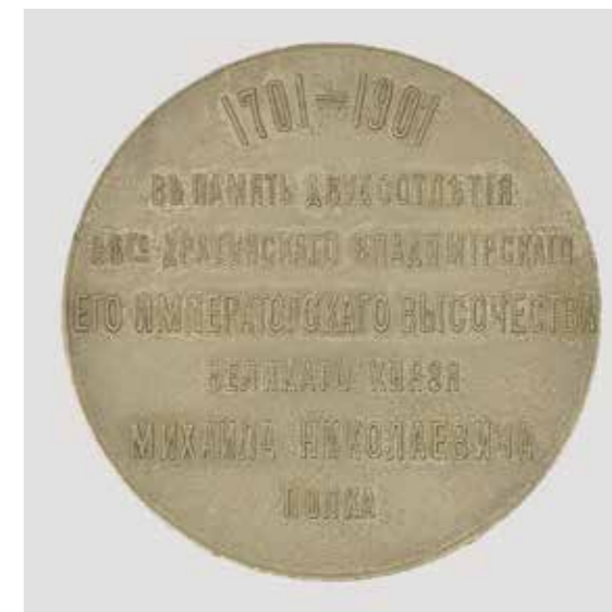
Ил. 9. Медаль в память 200-летия 38-го Драгунского Владимирского полка – подарок Е. И. В. В. К. Михаила Николаевича. А. А. Грилихес. Санкт-Петербургский монетный двор. 1901. Серебро. Диаметр 37 мм. Инв. № РМ-5238. Государственный Эрмитаж