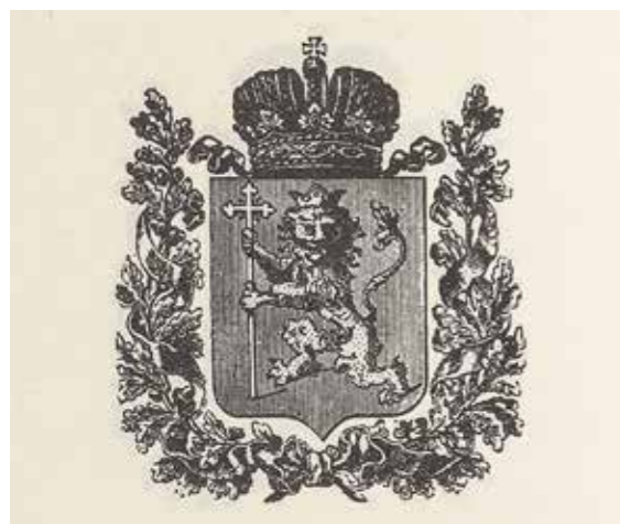
Ил. 6. Герб Владимирской губернии. Воспроизводится по: Гербы городов, губерний, областей и посадов Российской Империи. М., 1990. С. 178. Государственный Эрмитаж