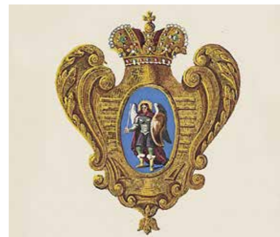
Ил. 8. Герб полков Владимирского гарнизона. Воспроизводится по: Историческое описание одежды и вооружения российских войск. Ч. 2. СПб., 1842. Л. 250. Государственный Эрмитаж

в мундирах 38-го Драгунского полка своего времени, однако на изображении мы видим императора Петра I в том же пехотном мундире, что и на первой медали. Николай II также изображен не в кавалерийском, а в пехотном, армейском мундире, о чем говорит скругленный воротник. Эполеты на мундире Николая II с вензелем Александра III. Можно было бы предположить, что это отличительный знак свитского мундира, но, принимая во внимание армейский тип воротника, без свитского шитья, остается предполагать, что это мундир одного из пяти армейских полков, имеющих на погонах вензель Александра III. Это мог быть 5-й Киевский гренадерский, 12-й Астраханский гренадерский, 2-й Софийский пехотный, 68-й Лейб-Пехотный Бородинский или 145-й Новочеркасский.