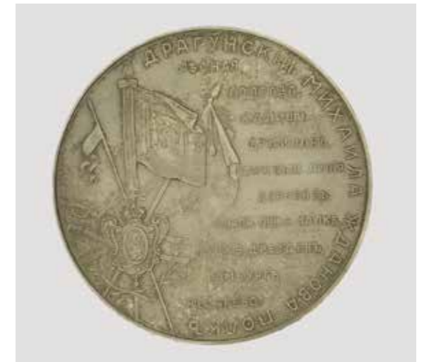
Ил. 1. Медаль в память 200-летия 38-го Драгунского Владимирского полка. А. А. Грилихес. Санкт-Петербургский монетный двор. 1901. Серебро. Диаметр 73 мм. Инв. № РМ-5236. Государственный Эрмитаж

к 200-летию юбилею полка. Но до нас дошли три типа медалей, выпущенные Санкт-Петербургским Монетным двором к этой дате 1 .