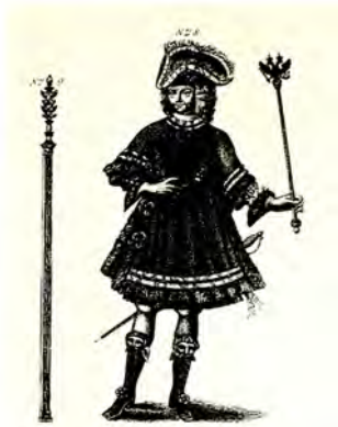
№ 2. Шуба, вышивка № 3. Желез. посох, вышивка