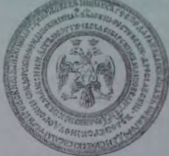
5. Золотая булла царя и великого князя Иоанна IV Васильевича. 1562 год