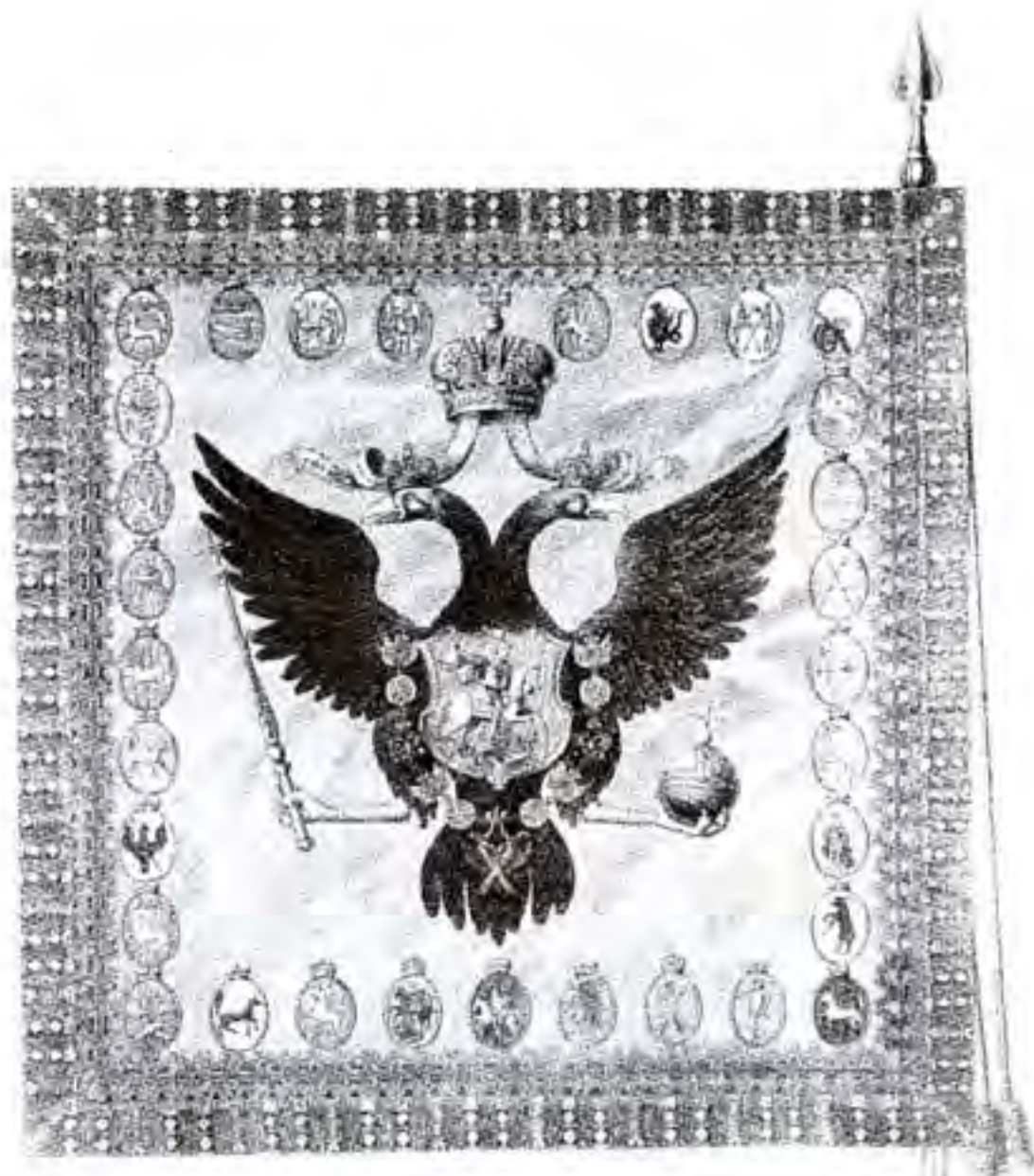
25. Рисунок Государственного знамени (Панира). 1742 год

При императоре Павле I в использовании двуглавого орла произошло существенное изменение. Указ от 5 апреля 1797 года определил право членов императорской фамилии использовать его как свой герб. 10 августа 1799 года Павлом I был подписан Указ о включении в состав Государственного герба мальтийских креста и короны. Знак ордена святого Андрея Первозванного с герба исчез.