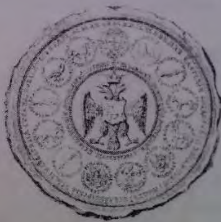
6. Печать Большая государственная царя Иоанна IV Васильевича. 1577–1578 годы