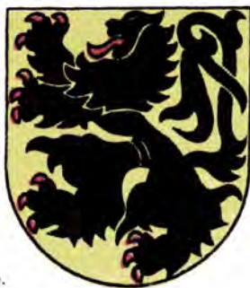
Герб графства Фландрского.