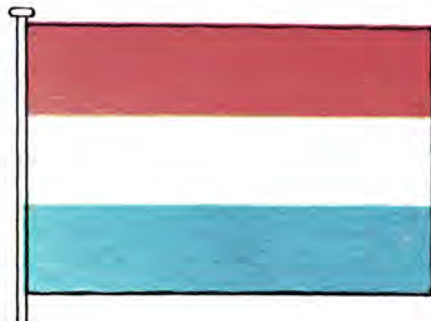
Государственный герб и флаг Королевства Нидерландов.

На современном гербе страны лев с мечом и пучком стрел помещен в лазоревое с золотым гонтом поле щита. Щит увенчан королевской короной.