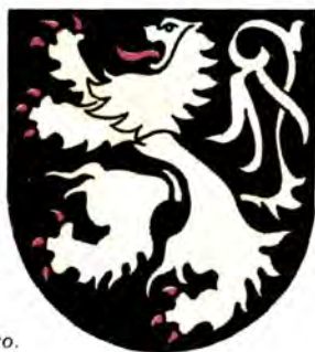
Герб герцогства Брабантского.

В гербе графства Фландрского в золотом поле щита был изображен черный лев с червленим вооружением. В гербе герцогства Брабантского — лев золотой с червленим вооружением в черном поле.