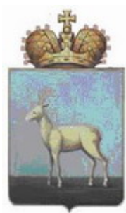
Рис. 31. Герб города Самары

Герб проекта города Екатеринбурга (рис. 32) увенчан пятизубцовой короной (автор - Д.Иванов, одобрен Геральдическим советом)