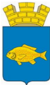
Рис. 12. Герб города Ишим Тюменской области

Однако, законом Тюменской области Тюменской области от 05.11.2004 № 263 «Об установлении границ муниципальных образований Тюменской области и наделении их статусом муниципального района, городского округа и сельского поселения» город Тюмень является городским округом. [25] Следовательно, корона должна быть «о пяти зубцах».