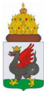
Рис. 18. Герб Казани

Герб города Казани (рис. 18), утвержденный решением от 24.12.2004 (государственная регистрация № 1700) «увенчан царским венцом – Казанской шапкой». [33] Как соотносить этот факт нормативного установления Казанской шапки в гербе городского округа Казани с предложенной «концепцией» короной о пяти зубцах?