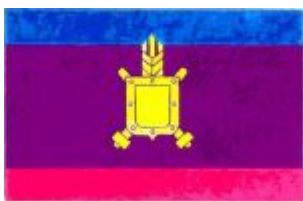
Рис. 12. Проект флага Челябинской области. 2001 год. Автор проекта Дмитрий Дольников (Челябинск).

Обвивающая лента выполнена в цветах флага Челябинской области, и внизу образует флаг с символом».