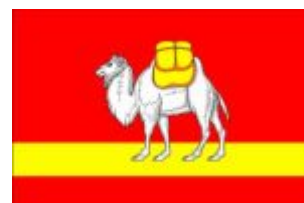
Рис. 16. Многоцветный рисунок флага Челябинской области.

Флаг Челябинской области (рис. 16) разработан на основе герба Челябинской области и утвержден Законом Челябинской области «О флаге Челябинской области» в качестве официального символа Челябинской области как субъекта Российской Федерации. [8]