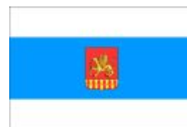
Рис. 6 Вариант флага Челябинской области. Автор проекта Вячеслав Старцев (Екатеринбург).

«В червленом поле идущий золотой крылатый лев с головой гончего пса (семаргл), держащий за клинок таковой же меч острием вниз, и оконечность червлено - золотого столбчатого беличьего меха. Щит увенчан золотой российской земельной короной; щитодержатели - два золотых соболя, стоящие на таковых же скалах, поверх которых положена лента Ордена Ленина».