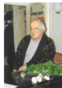
Рис. 1б. Автор музыки к гимну Челябинской области, композитор Михаил Смирнов.

Тобой мы гордимся, тебе мы верны, Наш Южный Урал - честь и слава страны.