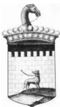
Рис.2. Первый проект герба Исетской провинции. 1737 год. Автор проекта В.Н. Татищев.

В.Н. Татищев составил два проекта герба для Исетской провинции (рис. 2, 3) которая в ходе губернской реформы была отнесена сначала к Пермской, а потом к Уфимской губернии. На утверждение императрице Екатерине представили оба варианта герба. На первом эскизе изображался щит с белой стеной на чёрном поле. К стене была привязана собака. Щит венчала татарская корона и голова верблюда. Стена символизировала уральские крепости, а собака подчёркивала их охранительные функции.