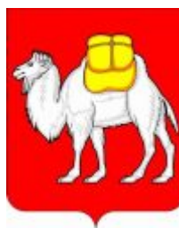
Рис. 15. Малый герб (гербовый щит) Челябинской области.