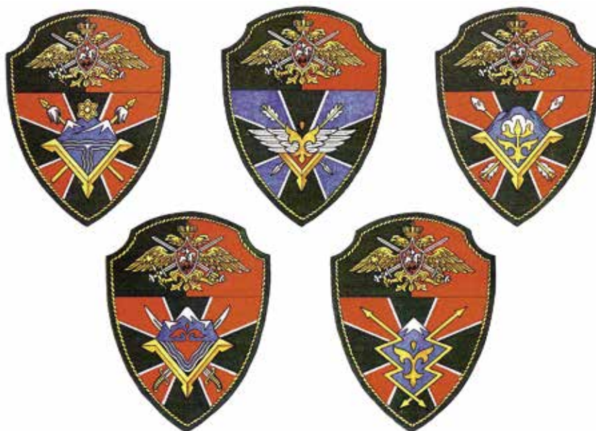
Ил. 8. Нарукавные знаки отрядов и авиационного полка пограничной группы ФПС России в Республике Таджикистан