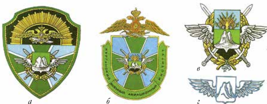
Ил. 9. Варианты символики Курганского военного института ФПС России: а – нарукавный знак; б – большая эмблема; в – средняя эмблема; г – малая эмблема

Это была наполненная живым творчеством и азартом работа. Символика эмблем частей была привязана к местам их дислокации. Но далеко не все населенные пункты в России имели на тот момент свою территориальную символику, а уж населенные пункты в Таджикистане или Киргизии – и подавно. Приходилось фактически строить неофициальные местные гербы, а для этого – изучать историю и специфику жизни конкретных поселений и регионов (ил. 10).