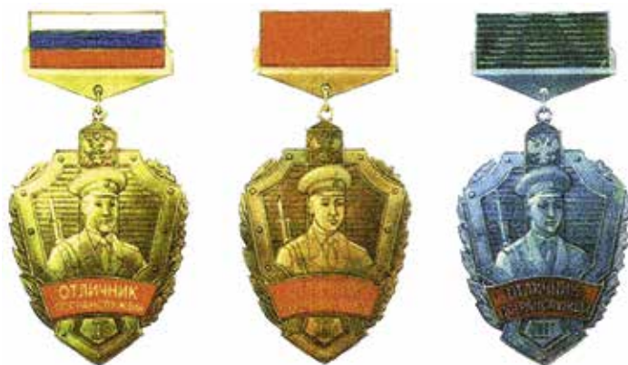
Ил. 2. Знак отличия «Отличник погранслужбы» трех степеней