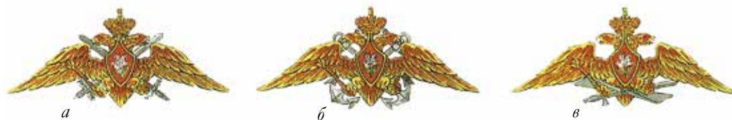
Ил. 5. Родовые модификации эмблемы ФПС России: а – эмблема Пограничных войск; б – эмблема морской охраны; в – эмблема авиации