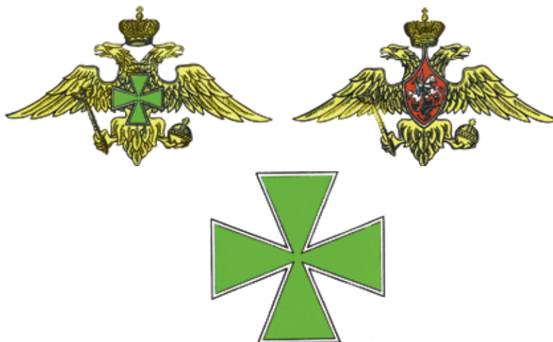
Ил. 7. Геральдический знак – эмблема органов пограничной службы и Пограничных войск Федеральной пограничной службы Российской Федерации. 1997