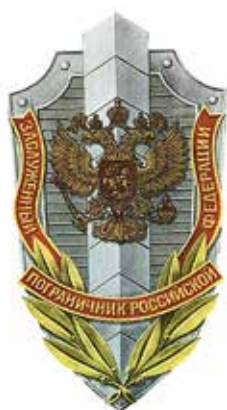
Ил. 4. Знак отличия «Заслуженный пограничник Российской Федерации»

В эти годы происходят серьезные изменения и в структуре органов безопасности России. Бывший КГБ СССР делится на несколько самостоятельных ведомств, одним из которых становится Федеральная пограничная служба Российской Федерации. Ее возглавил бывший первый заместитель начальника Генерального штаба Вооруженных сил генерал-полковник (позже генерал армии) А. И. Николаев.