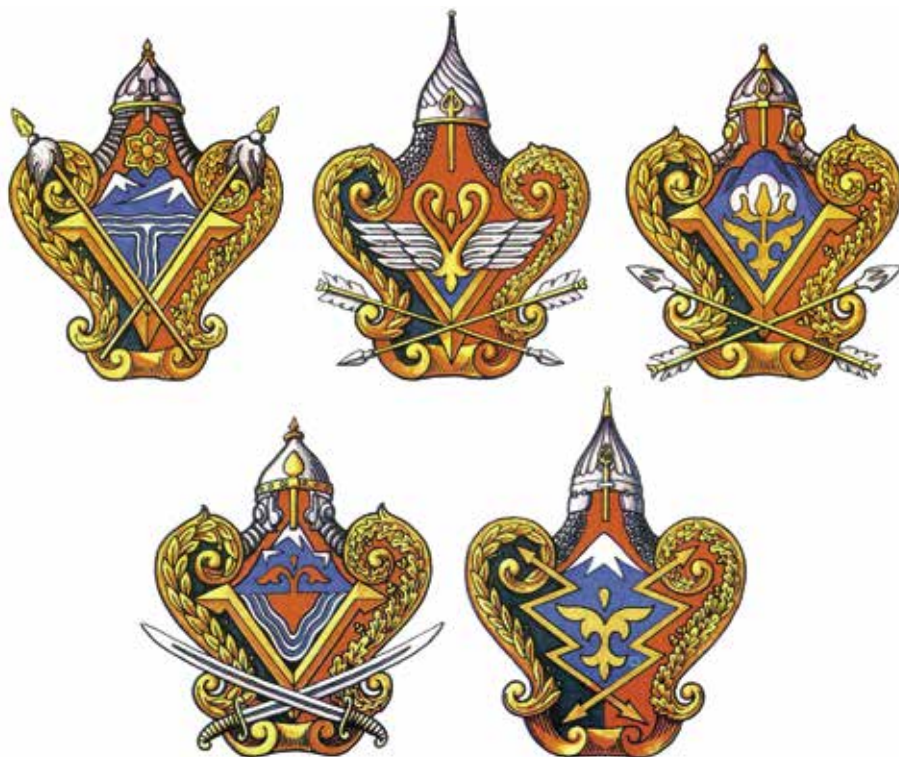
Ил. 10. Проекты знаменных гербов частей ФПС России