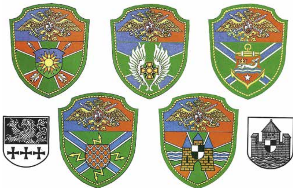
Ил. 11. Нарукавные знаки частей ФПС России