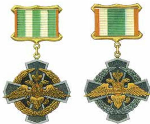
Ил. 3. Знак отличия «За заслуги в пограничной службе» I и II степеней