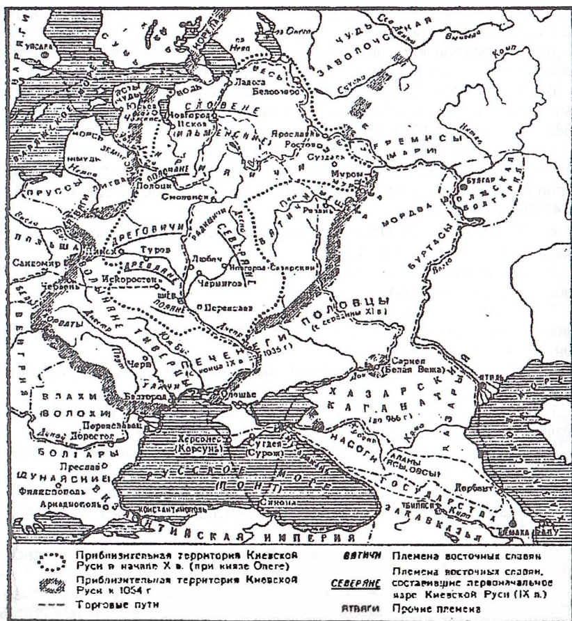
Рис. 1. Киевская Русь в IX – первой половине XI в.