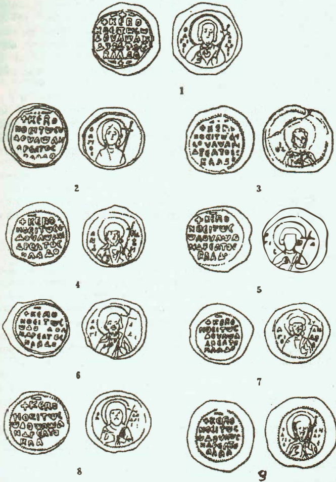
Рис. 2. Печати Всеволода Ярославича с пятистрочной легендой: 1, 2 — печати № 15 и 16 Корпуса; 3 — черниговская печать; 4—9 — печати № 17—№ 22 Корпуса