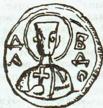
Прорись печатей Олиславы-Гертруды (по [12]).