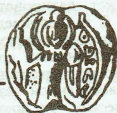
Прорись полоцкой печати-матрицы (?) XII-XIII (?) вв.