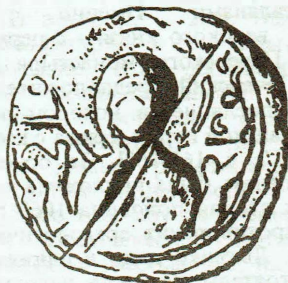
Прорись полоцкой печати XII (?) в.