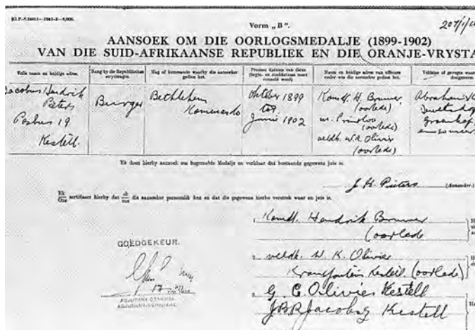
Ил. 9. Заявка на награждение медали АВО. 1953/1954 г.