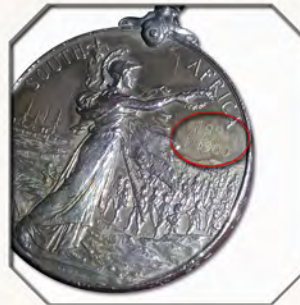
Ил. 2. Медаль королевы Южной Африки. Реверс. Видны затертые даты «1899» и «1900» (т.н. "ghost dates"). KMT.