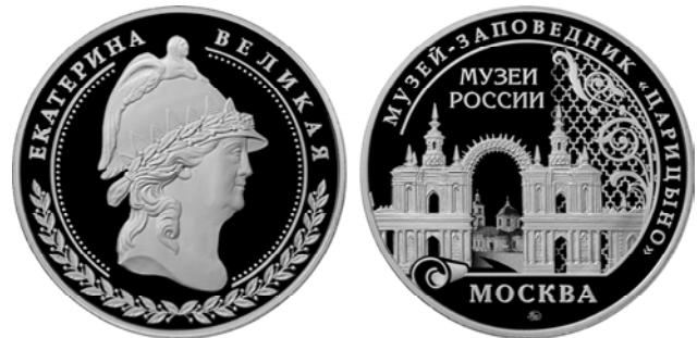
Ил. 4. Памятная медаль «Музей-заповедник “Царицыно”, Москва. Екатерина Великая». Серия «Музеи России». Худ. Т.В. Лифатова. ММД. Нейзильбер. 39 мм. 2025.

В апреле 2025 г. на Московском монетном дворе (ММД) к юбилею тиражом в 500 экземпляров была отчеканена памятная медаль в серии «Музеи России» (ил. 4). Медальер — художник ММД Тамилла Валерьевна Лифатова. На лицевой стороне медали рельефно изображена Галерея-ограда с воротами (архитектор В.И. Баженов, 1784–1785), через которые видна Церковь во имя иконы Божией Матери «Живоносный источник» (изображение выполнено лазерной гравировкой) — самый ранний памятник архитектуры на территории ГМЗ «Царицыно» (1765). На оборотной стороне изображен экспонат музея-заповедника — брошь-камея с погрудным портретом императрицы Екатерины II, созданная в 1789 г. (стекло молочное, стекло сердоликовое, золото; резьба, шлифовка, полировка; ил. 5 на с. 147). Автором модели и резчиком броши-камеи является великая княгиня Мария Федоровна (1759–1828).