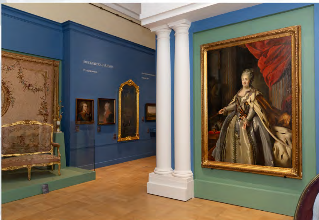
Ил. 2. Вид зала выставки «1775. Триумф Екатерины II. Московский год императрицы».