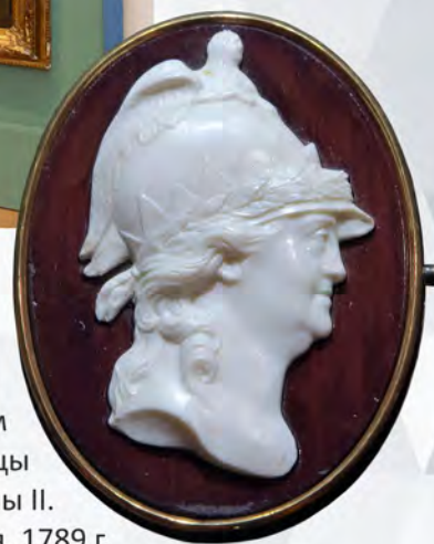
Ил. 5. Брошь-камень с портретом императрицы Екатерины II. Россия. 1789 г. Экспонат ГМЗ «Царицыно».