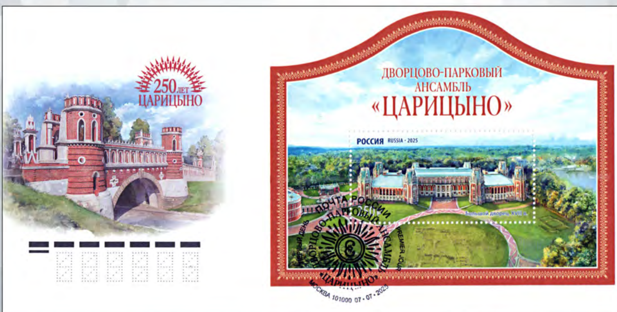
Ил. 6. КПД № 2477 «250 лет Дворцово-парковому ансамблю «Царицыно»». 07.07.2025.