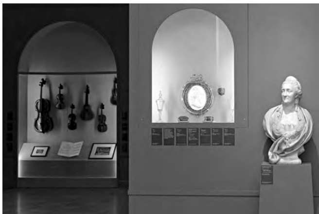
Ил. 1. Зал выставки «1775. Триумф Екатерины II. Московский год императрицы» в ГМЗ «Царицыно».

Главной выставкой 2025 года стал проект «1775. Триумф Екатерины II. Московский год императрицы» (даты проведения: с 22 апреля по 17 августа 2025 г.; ил. 1 и ил. 2 на с. 147). Выставка посвящена одному году из жизни Екатерины II. Во время своего продолжительного визита в Москву, который длился почти весь 1775 год, императрица праздновала на Ходынском поле заключение Кючук-Кайнарджийского мира с Османской империей, встречалась с турецким послом, проводила Губернскую и другие важные для империи реформы. И тогда же переименовала село Черная Грязь в Царицыно, распорядившись начать строительство новой резиденции, спустя две с лишним сотни лет ставшей одноименным музеем-заповедником. К выставке было подготовлено богато иллюстрированное издание (ил. 3 на с. 147).