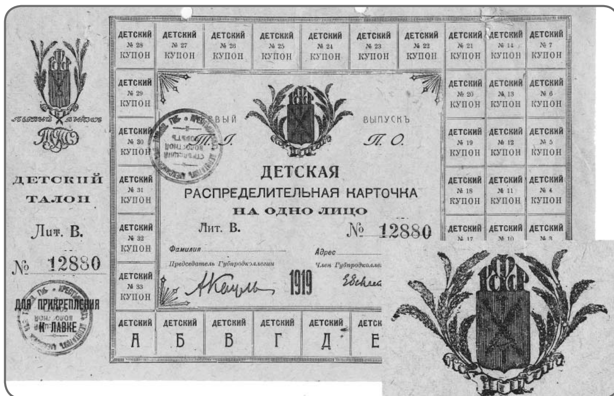
Изображение тульского герба на детской распределительной карточке на одно лицо первого выпуска Тульского городского потребительского общества (начало 1919 г.)