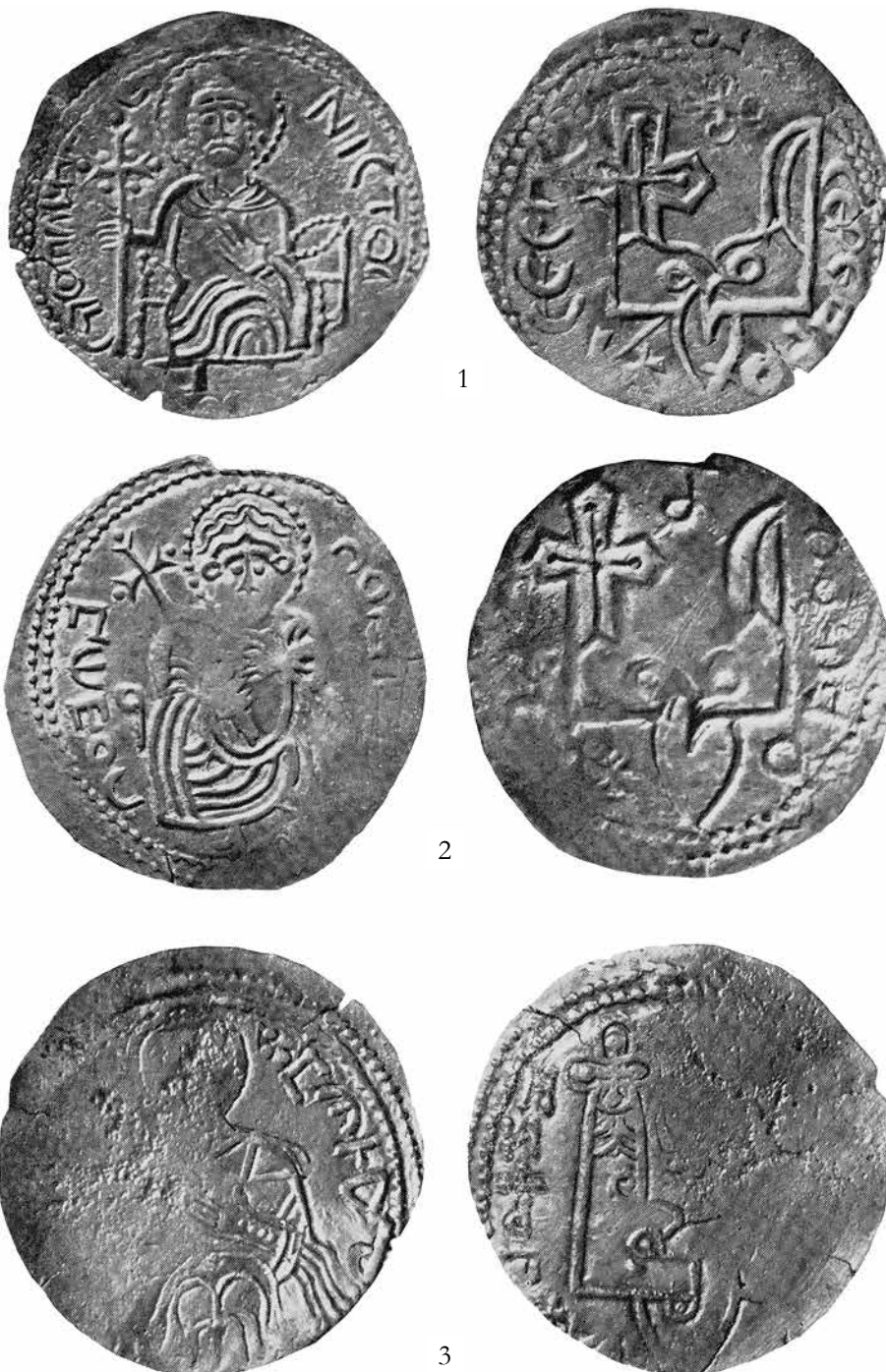
Ил. 3. Сребреники типа II–IV (1 – тип II, 2 – тип III, 3 – тип IV) Владимира Святославича. Местонахождение неизвестно. Воспроизведено по: Сотникова М. П., Спаский И. Г. Тысячелетие древнейших монет России : Сводный каталог русских монет X–XI веков. Л., 1983