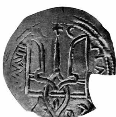
Ил. 4. Сребреники Святополка Ярополчича (1 – с именем «Святополк», 2 – типа «Петрос», 3 – типа «Петор»). Местонахождение неизвестно. Воспроизведено по: Сотникова М. П., Спаский И. Г. Тысячелетие древнейших монет России : Сводный каталог русских монет X–XI веков. Л., 1983