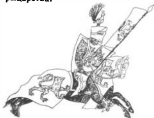
Рыцарь в полном вооружении. На знамени и на конском уборе изображена гербовая эмблема „леопардового льва“.

Многие древние земельные эмблемы могли легко превратиться в будущем в соответствующие гербы, хотя путь этот, конечно, не единственный. Он не объясняет своеобразной формы земельных гербов.