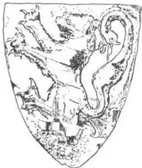
Боевой щит первых времен рыцарства.