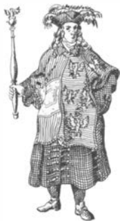
Герольд в одежде распорядителя турнира (Австрия).

Геральдические правила коснулись и названий отдельных животных и предметов. Например, лев, обычно „восстающий“, то есть стоящий или приподнимающийся на задних лапах, изображенный в профиль, так и называется львом, но лев, „шествующий“ на четырех лапах и держащий голову прямо (то есть повернутую к зрителю), называется леопардом. Маленькие кружки на щите принято именовать монетами и т. д.