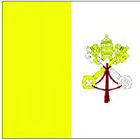
Государственный флаг Ватикана (8.09.1929)

ный крест (крест-потент), сопровождаемых четырьмя малыми золотыми крестами (так называемый иерусалимский крест или крест крестоносцев).