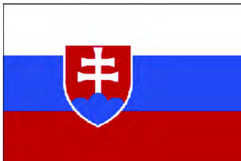
Государственный флаг Словакии (1.03.1990)

1 января 1993 г. в качестве государственного флага Словакии был утвержден бело-сине-красный национальный флаг с изображением Государственного герба у древка. 18 февраля 1993 г. Народный Совет Словацкой Республики принял Закон № 63 «О государственных символах Словацкой Республики», в § 7 которого опре-