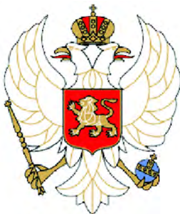
Государственный герб Черногории (30.05.1994)

вооружением, увенчанный золотой королевской короной; в правой лапе орла – золотой скипетр, в левой – голубая с золотым крестом держава; на груди орла – щиток с золотой каймой, в красном поле которого золотой идущий лев.