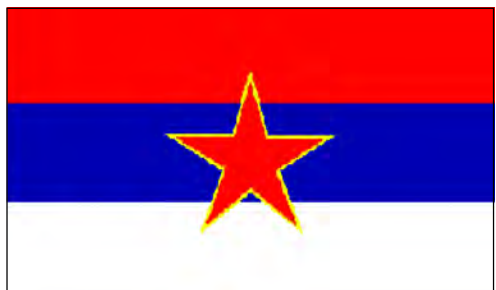
Флаг Союзной Республики Черногория (31.12.1946)

После образования социалистической республики, 31 декабря 1946 г., этот флаг был дополнен изображением красной звезды с золотой каймой. В 1992 г. звезда была с флага удалена, а в августе 2000 г. этот флаг был официально утвержден Государственным флагом Черногории.