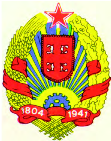
Герб Союзной Республики Сербия (17.01.1947)

Гербом Сербии в составе Югославской Федерации было изображение красного щита с четырьмя серебряными огнивами на фоне золотых лучей восходящего на синем небосводе солнца. Все это обрамлял золотой венок из колосьев (справа) и дубовых ветвей. Венок был перевит красной лентой, на которой были написаны даты: «1804» (начало антитурецкого восстания) и «1941» (начало народно-освободительной войны). В основании венка, на фоне солнца, изображена синяя шестерня, венчала герб красная пятиконечная звезда с золотой каймой.