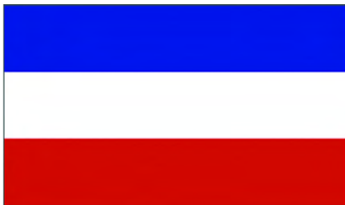
Флаг объединения Сербии и Черногории (2003)

Этот флаг остался неизменным и после изменения названия страны, и после изменения статуса объединения двух ее республик.