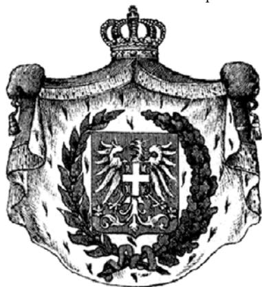
Герб Сербии (1835)

В результате Второго сербского восстания (1815), которое возглавил Милош Обренович, в 1817 г. было провозглашено автономное Сербское кня-