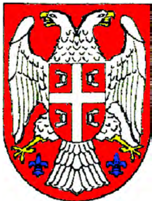
Малый Государственный герб Сербии (1992)

разованных им четырех полях – по серебряному огниву. По обе стороны хвоста орла – по золотой геральдической лилии. Четыре огнива символизируют девиз «Только согласие может спасти Сербию».