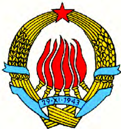
Государственный герб СФРЮ (7.04.1963)

После провозглашения республики королевские символы были упразднены. Государственный герб Социалистической Федеративной Республики Югославия был утвержден в мае 1945 г. Он представлял собой серебряное поле, обрамленное золотыми колосьями пшеницы; в нижней части колосья перевязаны лентой синего цвета, на которой написана дата «29.XI.1943»; между верхушками колосьев расположена красная пятиконечная звезда; в середине поля изображены пять веерообразно расположенных факелов, пламя которых соеди-