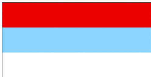
Государственный флаг Черногории (1992)

Красно-сине-белый флаг впервые появился примерно в 1860-х гг., как флаг независимого княжества Черногории, но затем, под влиянием Сербии, чередование цветов было изменено.