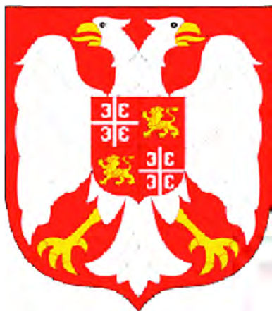
Герб Сербии и Черногории (2003)

7 апреля 1963 г. герб был изменен – был добавлен шестой факел и герб стала венчать новая красная звезда – с золотой каймой. Шесть факелов, пламя которых сливалась воедино, символизировали единство республик в составе Югославии: Сербия, Словения, Хорватия, Босния-Герцеговина, Черногория и Македония. Красная звезда (стороны лучей звезды образуют угол в 105 градусов) символизировала социалистический путь развития страны.