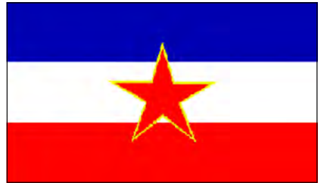
Государственный флаг СФРЮ (7.04.1963)

После освобождения Югославии от оккупантов, 29 ноября 1945 г., была провозглашена Федеративная Народная Республика Югославия, а 31 января 1946 г. флаг Народно-освободительной армии Югославии был утвержден государственным флагом страны (пропорции флага 1 : 2). Звезда на флаге стала символизировать единство народов страны и ее движение по пути социализма.