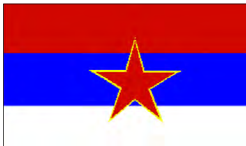
Флаг Союзной Республики Сербия (17.01.1947)

17 января 1947 г. на красно-сине-белом флаге появилась красная пятиконечная звезда с золотой каймой. В 1992 г. звезда была с флага удалена.