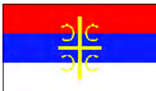
Флаг Республики Сербской (Босния и Герцеговина)