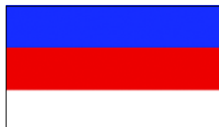
Национальный флаг Лужицких сербов (Германия)