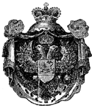
Герб Черногории (1878)

Первоначально гербом Черногории был серебряный двуглавый орел, расположенный на горностаевой мантии, увенчанной короной. В лапах орел держал скипетр и державу и был увенчан короной. На его груди располагался щит с золотым леопардовым львом в голубом поле на зеленом подножии. До 1910 г. короны были княжескими, а после – королевскими.