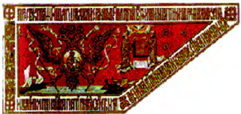
Знамена периода Алексея Михайловича

гербы подвластных царю земель, на кайме – легенда.