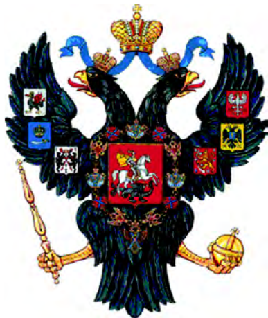
Герб России в период правления Николая I (1832)

земли) и трех царств – Казанского, Астраханского и Сибирского. А орел изображался увенчанным тремя коронами, со Святым Георгием (как гербом Великого княжества Московского) в щитке на груди, окруженным цепью ордена Святого Андрея Первозванного, со скипетром и державой в лапах.