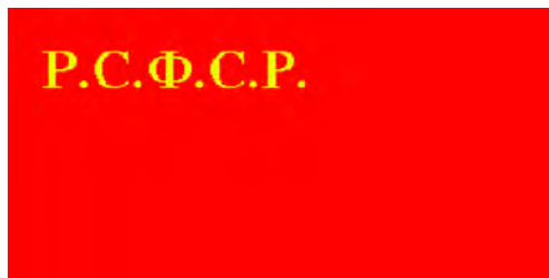
Флаг РСФСР (1920)

Это постановление в качестве статьи 90а было включено в Конституцию РСФСР. К печатному образцу изображения флага было дано его описание: «Флаг Российской Республики – красного цвета. В левом верхнем углу буквы Р.С.Ф.С.Р. согласно рисунку. Буквы золотые, равно как и 2 стороны (нижняя и правая) прямоугольника, в коем они помещены. Длина флага вдвое больше ширины, длина прямоугольника для букв в два с половиной раза меньше длины флага, ширина прямоугольника вдвое меньше ширины флага».