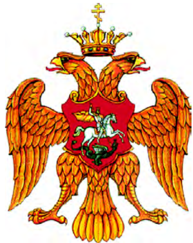
Герб России во время Великого князя Ивана Грозного (1562)

Начиная с 1539 г. изменяется тип орла на печати великого князя Московского. В эпоху Ивана IV Грозного на золотой булле (государственной печати) 1562 г. на груди двуглавого орла появилось изображение всадника («ездец») – одного из древнейших символов княжеской власти на Руси. «Ездец» помещен в щите на груди двуглавого орла, коронованного одной или двумя коронами, увенчанными