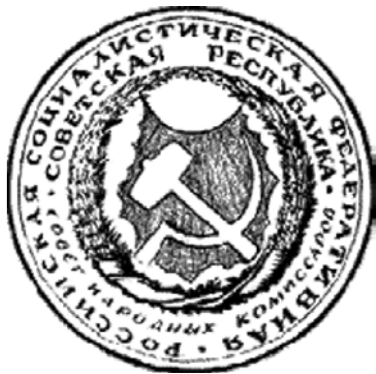
Печать СНК РСФСР (15.05.1918)