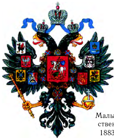
Малый Государственный герб, 1883–1917 гг.

Обновленные версии Среднего и Малого гербов были изготовлены Гербовым отделением департамента Герольдии Правительствующего Сената, обсуждались по докладу бывшего министра юстиции статс-секретаря Набокова и были утверждены 23 февраля 1883 г. (Полное собрание законов Российской империи. Собрание 3-е.