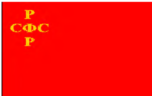
Варианты флага РСФСР (1918)

10 июля 1918 г. 5-й Всероссийский съезд Советов утвердил так называемый «военный флаг»: красное полотнище, в первой четверти которая была окантована золотой узкой полоской, находились написанные славянской вязью золотые буквы «Р.С.Ф.С.Р.» или надпись «Российская Социалистическая Федеративная Советская Республика». Вскоре был утвержден и Государственный флаг. В Конституции РСФСР 1918 г. записано: «Раздел 6, гл. XVII, § 90. Торговый, морской и военный флаг Российской Социалистической Федеративной Советской Республики состоит из полотнища красного (алого) цвета, в левом углу которого – у древка, наверху, помещены золотые буквы «РСФСР» или надпись «Российская Социалистическая Федеративная Советская Республика». Причем в первом издании Конституции надпись на флаге располагалась крестообразно в три строки: Р-СФС-Р.