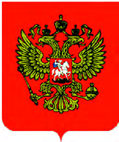
Государственный герб Российской Федерации (2000)

Рисунки Государственного герба Российской Федерации в многоцветном и одноцветном вариантах помещены в приложениях 1 и 2 к Федеральному конституционному Закону.