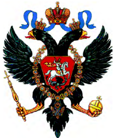
Герб России в период правления Петра I (1710)