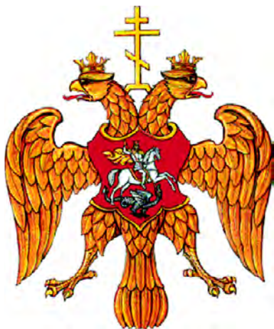
Герб России в период правления царя Федора Ивановича (1589)

В период правления царя Федора Ивановича между коронованными головами двуглавого орла изображался так называемый «голгофский крест». Он был символом православия, придающим религиозную окраску гербу государства.