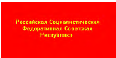
Первый (8.04.1918) флаг РСФСР (реконструкция автора)

писью «Российская Социалистическая Федеративная Советская Республика». Изображения этого флага не сохранилось, поэтому о том, каковы были его размер и пропорции, а также о цвете надписи можно только догадываться.