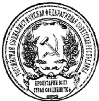
Печать РСФСР (19.06.1918)