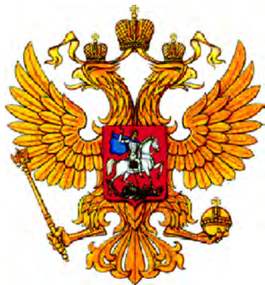
Государственный герб Российской Федерации (30.11.1993)