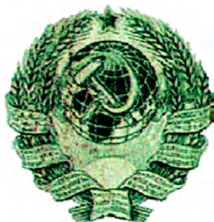
Герб СССР (конец 1920-х)