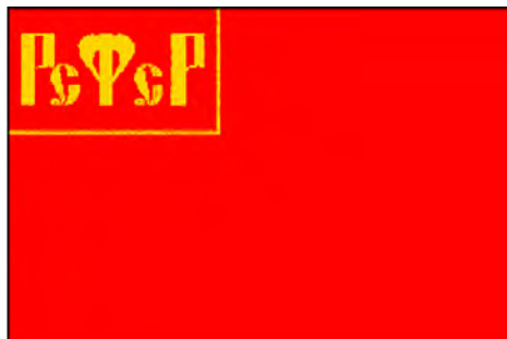
Флаг РСФСР (17.06.1918)

17 июня 1918 г. ВЦИК утвердил образец изображения государственного флага РСФСР, разработанный художником-графиком Сергеем Васильевичем Чехониным. Новый флаг представлял собой красное прямоугольное полотнище, в верхнем углу которого, у древка, была помещена надпись «РСФСР» золотыми буквами, стилизованными под древнеславянские. Эта надпись от остальной части полотнища была отделена с двух сторон тонкой золотой линией, образующей прямоугольник. Печатный образец изображения флага сопровождало описание: «Флаг Российской Республики – красного цвета. В верхнем левом углу нашиваются или наносятся краской буквы Р.С.Ф.С.Р согласно рисунку. Буквы золотые, но для обычного употребления (украшения домов и прочее) можно употреблять желтые, по оттенку напоминающие золото. Длина флага вдвое больше ширины, длина прямоугольника для букв в два с половиной раза меньше длины флага, ширина прямоугольника вдвое меньше ширины флага».