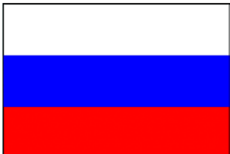
Флаг военного флота (1697–1700) и коммерческих судов (1705–1917)

Именным Указом № 2021 от 20 января 1705 г. Петр I утвердил бело-