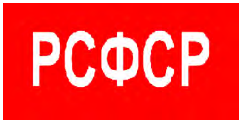
Разновидность флага (20.04.1918)

Кроме того, существовало несколько разновидностей этого флага. Так, Приказ от 20 апреля 1918 г. № 320 по флоту и морскому ведомству, разъяснял правила использования нового «национального и военного красного флага» и разрешал на флагах малых размеров надпись выполнять не полностью, а сокращенно.