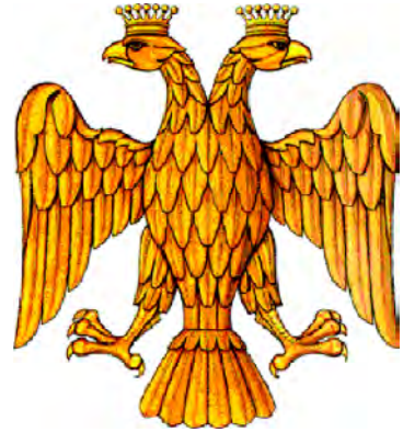
Герб России во время Великого князя Ивана III (1494–1497)

На лицевой стороне печати Ивана III изображался всадник, поражающий копьем змея. Подобные изображения использовались на княжеских печатях Руси с XIII в., то есть они были традиционными. К тому же изображение всадника на печати было данью общеевропейской моде того времени. Всадник («ездец») обычно трактуется как обобщенный образ защитника русской земли. Изображение всадника иногда воспринималось в Западной Европе в качестве герба Московии (напр., австрийским дипломатом С.Герберштейном в «Записках о Московии»), так как на русских монетах до реформы 1534 г. изображался именно всадник (монеты получили имя «копейка» – от копья, которым всадник убивает змея). Считается, что это было своеобразным портретом князя, хотя западноевропейские путешественники