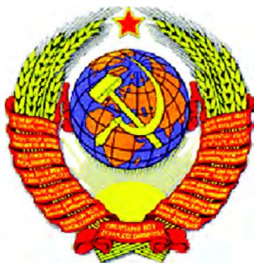
Герб СССР (1956)

В таком виде герб просуществовал до 1991 г.