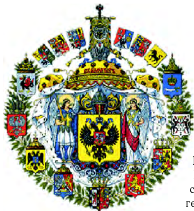
Большой Государственный герб (1882)

с гербом Туркестана. (Полное собрание законов Российской империи. Собрание 3-е. Т. II. № 1035). 3 ноября 1882 г. были утверждены описание Большого герба и полный императорский титул (Полное собрание законов Российской империи. Собрание 3-е. Т. II. № 1159).