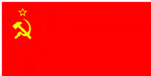
Государственный флаг СССР (18.04.1924)

Президиум ВЦИК исключил крыж из флага и после этой поправки рисунок флага 18 апреля 1924 г. был утвержден.