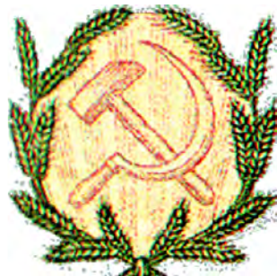
Проекты герба РСФСР (1918)

должны были изображаться рабочий и крестьянин, текст «РСФСР», орудия труда, лозунг «Пролетарии всех стран, соединяйтесь!». По итогам конкурса лучшими работами были признаны проекты Митурича, Альтмана, С.В.Чехонина.