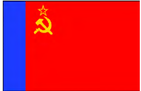
Флаг РСФСР (9.01.1954 – 25.12.1991)

– у древка красного флага была добавлена вертикальная полоса шириной в 1/8 длины полотнища, в верхней левой части красного поля помещались золотые серп и молот и красная звезда, обрамленная золотой каймой. Голубой цвет, как объясняли создатели флага, «является традиционным для русского народа». Другое объяснение голубого цвета – «смелое покорение русским народом воздушной и морской стихий». Такой флаг РСФСР просуществовал до 1991 г.