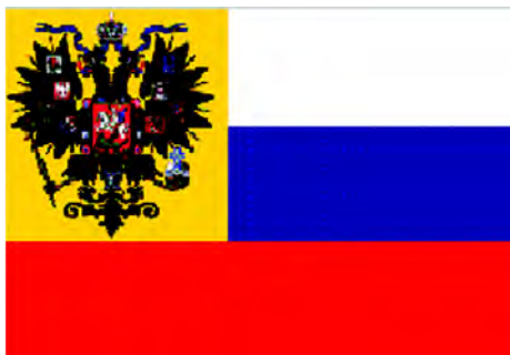
Флаг, введенный в 1914 г. «для употребления в частном быту»

В 1914 г. особым циркуляром министерства иностранных дел был учрежден «для употребления в частном быту» новый национальный флаг, призванный стать символом единения царя и народа – бело-сине-красный, в первой четверти которого был желтый квадрат с изображением черного двуглавого орла (композиция, соответствующая дворцовому штандарту императора – С.Л. ) без титульных гербов на крыльях; квадрат перекрывал белую и около четверти синей полосы флага. Но этот флаг не вводился как обязательный, его использование лишь «разreshалось».