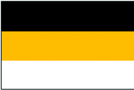
«Гербовый» флаг, введенный 11.06.1858 г.