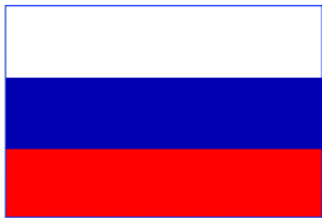
Национальный флаг (1917–1918)

25 октября (7 ноября) 1917 г. в Петрограде произошло восстание, в результате которого Временное правительство было низложено, власть перешла в руки Советов. Тогда же, 25 октября (7 ноября) 1917 г., 2-й Всероссийский съезд рабочих и солдатских депутатов провозгласил Россию советской республикой.