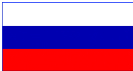
Флаг РСФСР (22.08.1991)