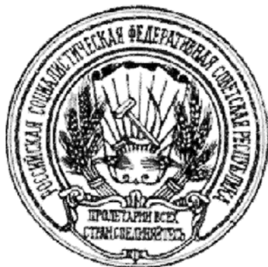
Печать РСФСР (18.07.1918)

Серп и молот в гербе символизировали нерушимый союз рабочих и крестьян, красный цвет – революцию, творческое созидание, борьбу; солнце – благородную цель построения комму-