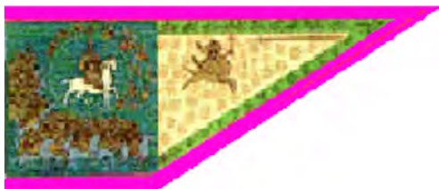
Знамена Ивана Грозного

Христос. Знамя имеет кайму «брусничного цвета», а у откоса – дополнительно кайму «макового» цвета.