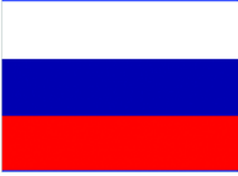
Флаг России (11.12.1993)

символики. Дело в том, что согласно Конституции герб и флаг страны должны утверждаться отдельным Законом, реально же герб, принятый еще Верховным Советом, был введен лишь Указом Президента Б. Ельцина. Флаг России также не был оформлен соответствующим законом. Поэтому от имени Президента в Государственную Думу был внесен проект о законодательном утверждении существующих флага и герба. Новый герб не устроил прежде всего депутатов-коммунистов, считавших его монархическим. Поэтому вопрос не был решен.