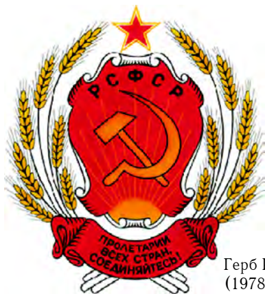
Герб РСФСР (1978–1993)

Описание герба в тексте Конституции стало таким: «Статья 180. Государственный герб Российской Советской Федеративной Социалистической Республики представляет собой изображение серпа и молота на красном фоне в лучах солнца и в обрамлении колосьев с надписью: «РСФСР» и «Пролетарии всех стран, соединяйтесь!» В верхней части герба – пятиконечная звезда». Положение о гербе РСФСР было утверждено Указом Президиума Верховного Совета республики от 22 января 1981 г.