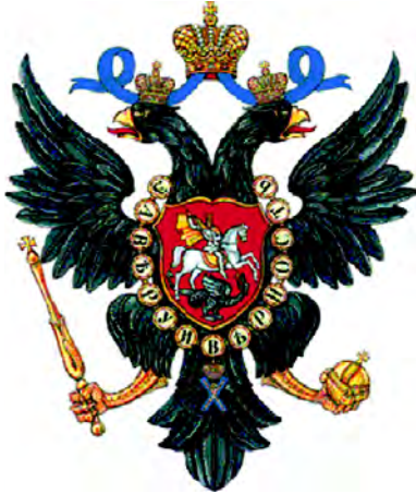
Герб России в период правления Анны Иоановны

В 1730 г. при Анне Иоанновне был утвержден новый рисунок герба и его цвета: «двоглавый орел черный, на главах короны, а наверху в середине Большая Императорская корона – золотые, в середине того орла Георгий на коне – белый, побеждающий змия, епанча и копье желтые, венец желтый же, змий черный, поле кругом белое, а в середине красное». Также при Анне Иоанновне (и при других императрицах) вместо цепи ордена Андрея Первозванного на гербе иногда изображались буквы девиза ордена: «За веру и верность», каждая в лучистом круге.