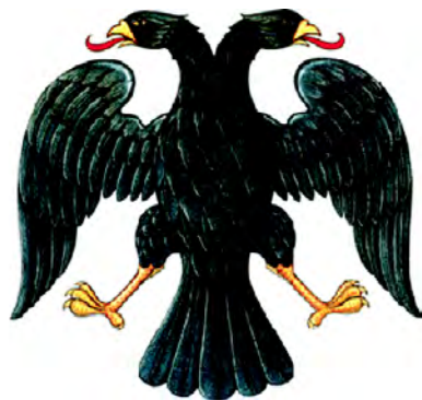
Герб России (1917)

7 апреля 1917 г. Правительствующий сенат по докладу министра иностранных дел распорядился опубликовать рисунок новой печати в «Собрании узаконений и распоряжений Правительства». Но новый герб, именно как герб, специально не утверждался. Однако, поскольку государственная печать традиционно считается гербовой, само собой подразумевалось, что изображение на государственной печати и есть герб.