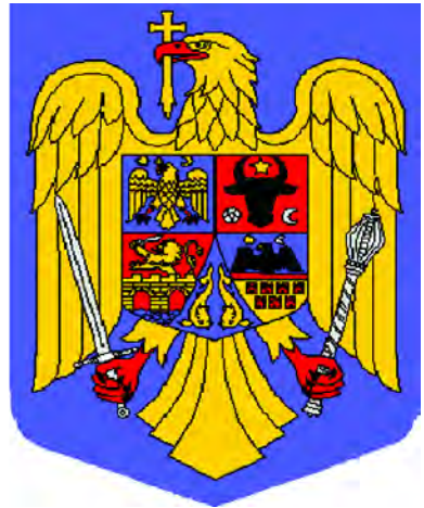
Государственный герб Румынии (1992)

Современный герб Румынии принят в 1992 г. На нем в голубом поле изображен золотой орел с красным вооружением, который держит в клюве крест, а в лапах серебряные меч (в правой) и скипетр (в левой). На груди орла щиток с пятью гербами исторических провинций: Валахии, Молдовы, Трансильвании, Добружи и Баната.