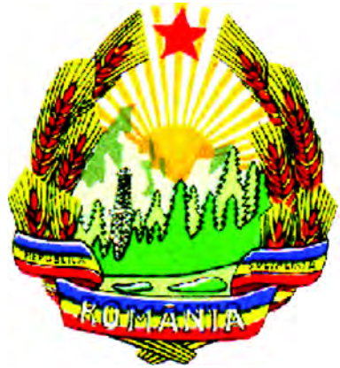
Государственный герб Румынии (21.08.1965 – 1989)

С падением режима Чаушеску этот герб был отменен.