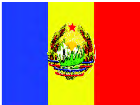
Государственный флаг Румынии (21.08.1965 – 27.12.1989)

Герб Румынского королевства представлял собой синий щит с изображением орла, в сердце герба – щит с гербами отдельных частей страны. В первой части, на центральном щитке, герб династии Гогенцоллернов: серебряно-черный рассеченный и пересеченный щит; во второй части – герб Валахии: в голубом поле изображен золотой орел, сопровождаемый золотым солнцем; в третьей – герб Молдовы (в красном поле золотая голова зубра, сопровождаемая золотыми пятиконечной звездой и полумесяцем); в четвертой – герб Олтении (в красном поле золотой вздыбленный коронованный лев, держащий в лапах золотую шестиконечную звезду и стоящий на золотой короне); в пятой – герб Добружа (в голубом поле два золотых ныряющих дельфина). Под щитом располагалась голубая лента с девизом, вышитым золотом: «NIHIL SINE DEO», под ней – знак Ордена Звезды Румынии.