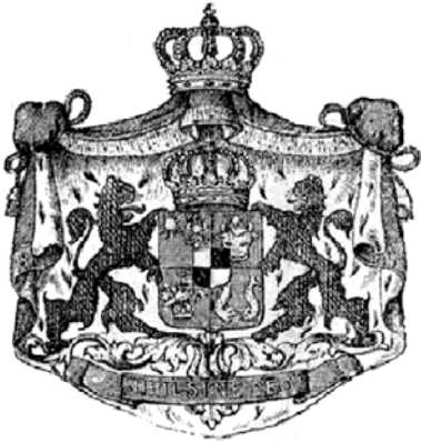
Герб Румынского королевства (XIX в.)

Первый герб Народной Республики Румыния был утвержден 8 января 1948 г. На нем изображены трактор, дымящаяся фабричная труба и три домы на фоне восходящего солнца, в обрамлении пшеничных колосьев. Однако этот герб просуществовал несколько месяцев и вскоре был утвержден новый вариант: с изображением восходящего из-за гор солнце, перед горами – лес и нефтяная вышка (справа); герб обрамлен венком из колосьев пшеницы, который перевит в нижней части лентой, имеющей цвета Государственного флага. В 1952 г. герб был увенчан красной пятиконечной звездой. 21 августа 1965 г. герб претерпел последнее изменение: на ленте вместо букв «RPR» (т.е. Румынская Народная Республика) было помещено новое полное название страны «Румынская Социалистическая Республика».