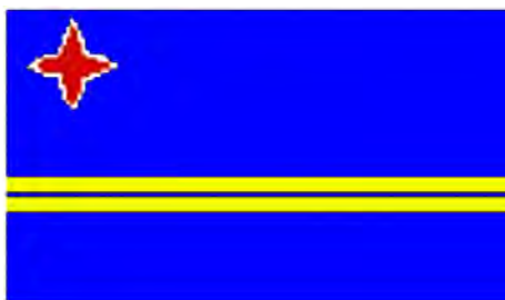
Флаг Арубы (18.03.1976)

Флаг (отношение сторон 2 : 3) утвержден 18 марта 1976 г. Он состоит из голубого полотнища, в первой четверти которого изображена красная четырехлучевая звезда с белой каймой, а в нижней части — две желтые полосы шириной 1/18 ширины флага (пропорции полос флага 12 : 1 : 1 : 1 : 3). Четырехлучевая звезда символизирует согласие живущих на острове людей. Ее красный цвет — землю острова и местных жителей — индейцев, белая кайма — белый песок морских пляжей, голубое полотнище — море и надежду, а желтые полосы — солнце, минеральные богатства острова и цветы алоэ — символ природы острова.