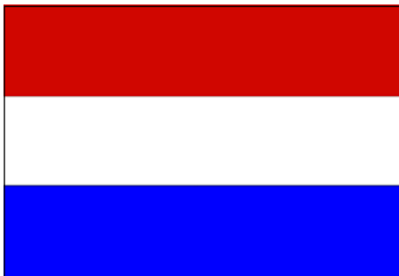
Национальный флаг Нидерландов (19.02.1937)

Последние изменения нидерландского флага произошли 19 февраля 1937 г., когда было установлено, что отношение ширины национального и морского флагов к его длине составляет 6 : 9, кроме того, темно-синий цвет нижней полосы был заменен на кобальтовый. А в знак признания заслуг Вильгельма Оранского была уста-