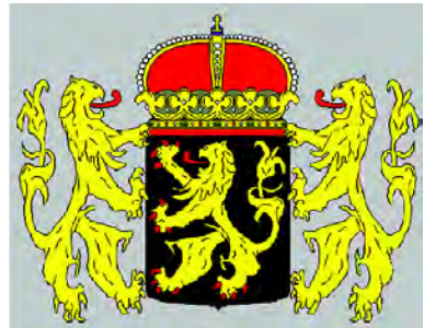
Герб Северного Брабанта

Герб повторяет герб Брабанта: в черном поле изображен золотой бросающийся лев с красным вооружением. Это древний герб герцогства Брабант, известный с XII в. Он происходит от герба основателя герцогства – Готтфрида, графа фон Левен, который с 1105 г. был герцогом Лотарингии. Герб Брабанта впервые появился примерно в 1190 г. на печати герцога Генриха I (1186–1235). Герб увенчан королевской короной, щитодержатели – два золотых брабантских льва.