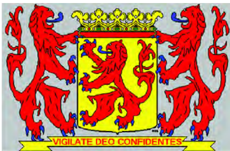
Герб Южной Голландии

Герб – в золотом поле изображен красный бросающийся лев с голубым вооружением. Это древний и неизменный герб графства Голландия. Щитодержатели герба – два такие же льва. Щит увенчан золотой графской короной и имеет девиз: «VIGILATE DEO CONFIDENTES».