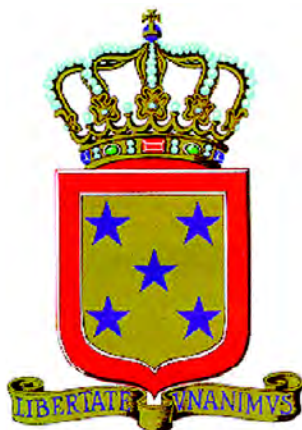
Герб Антильских Ниделандс- ких остро- вов