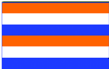
Флаг Нидерландов (XVI в.)

26 июля 1581 г. Генеральные штаты (Собрание парламентов провинций) объявили себя независимыми от Испании и избрали своим правителем