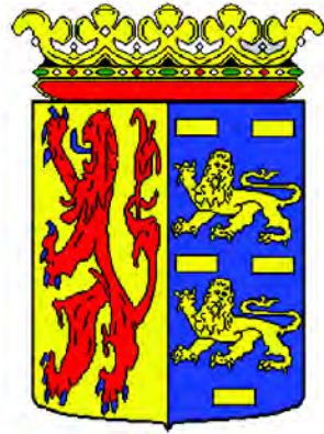
Герб Северной Голландии

Герб и флаг провинции происходят от герба и флага герцогства Брабант.