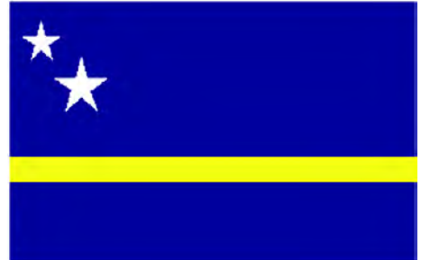
Флаг Кюрасао (2.07.1984)

Звезды символизируют два острова, разделенные проливом, желтая полоса – мирный характер жителей островов, голубое поле – океан и лояльность жителей.