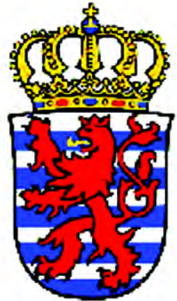
Малый Государственный герб Люксембурга (16.08.1972)

рном поле изображен красный лев с двойным хвостом. По-видимому, этот герб происходил от еще более древнего родового герба. Впоследствии Вальрам изменил герб, сделав поле герба из чередующихся серебряных и голубых поясов. Вначале делений полей было семь, а впоследствии стало девять.