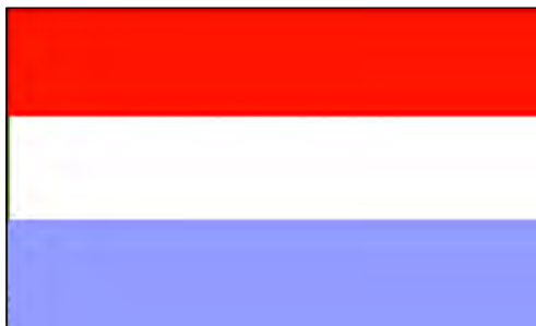
Государственный флаг Люксембурга (16.08.1972)

Хотя флаг Люксембурга и похож на флаг Нидерландов, но он имеет свою