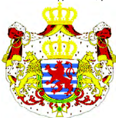
Большой Государственный герб Люксембурга (16.08.1972)

Поле гербового щита Большого Государственного герба герцогства пересечено девять раз на серебряные и голубые части. В поле изображен красный лев с двойным хвостом и золотым вооружением, увенчан-