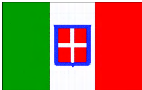
Флаг Италии (1848)

23 марта 1848 г. король Карл Альберт обратился со знаменитой речью к населению Ломбардо-Венецианской области и объявил о начале первой войны за независимость. Его речь заканчивалась словами: «...чтобы полнее выразить чувство национального единства, мы хотим, чтобы наши войска ... несли герб Савойской династии на трехцветном итальянском знамени». Во избежание слияния белого и красного цветов герба с такими же цветами на флаге, на династический герб решено было добавить синюю окантовку.