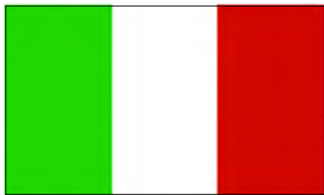
Флаг Италии (24.03.1947)

Национальный флаг с изображением герба объединенной Италии является торговым и военно-морским флагом. Герб, помещенный в центре флага, четырехчастный, он состоит из