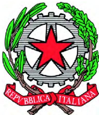
Государственный герб Италии (5.05.1948)

Творческий процесс создания этого герба продолжался почти два года. В двух объявленных конкурсах приняло участие около 500 человек, среди ко-