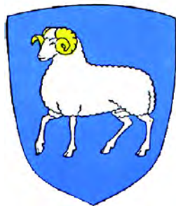
Герб Фарерских островов

В VIII в. острова открыли и стали заселять ирландские монахи. Они привезли на острова овец и стали их здесь разводить (до настоящего времени овечья шерсть является «фарерским золотом»). Поэтому со временем овцы стали символом островов: известно письмо, датированное XIV в., которое было запечатано печатью с изображением головы барана. Примерно с 1530 г. на печатях стало изображаться полностью все животное. Впоследствии, примерно с 1600 г., появился и герб Фарер с таким же изображением.