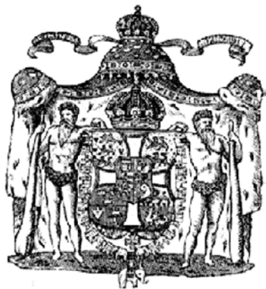
Герб Дании (XIX в.)

Цвета герба известны с 1280 г., когда они были описаны в немецкой и французской рукописях. Вальдемар II Победитель (1202–1241) увенчал головы леопардов коронами, в знак своих побед. Девять сердец на гербе, которые являются на самом деле листьями морской лилии, появились на гербе в 1819 г. Они первоначально были фигурами, заполняющими свободное