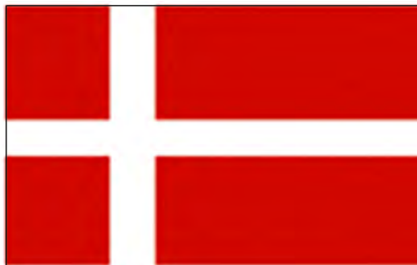
Национальный флаг Дании (11.07.1948)

Кроме того, на монетах XII в. уже изображались знамена с крестами, однако иногда считается, что эти знамена символизировали власть архиепископов. Некоторые историки предполагают, что Вальдемар Великий (1157–1182) скопировал рисунок «Даннеброга» со знамени Ордена Иоаннитов.