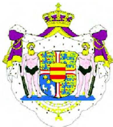
Государственный герб Дании и королевский герб (16.11.1972)

Фарерские острова принадлежат Дании с 1380 г., в 1854 г. они получили ограниченное самоуправление, а с 1948 г. являются автономной составной частью датского королевства.