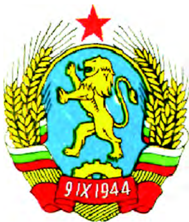
Государственный герб Болгарии (1944)

золотых колосьев, перевитых в нижней части лентой цветов национального флага, в верхней части поле имеет золотой кант; в основании герба красная лента с датой «9.IX.1944». Авторы рисунка герба – художник Стоян Сатиров и скульптор Николай Шмиргела.