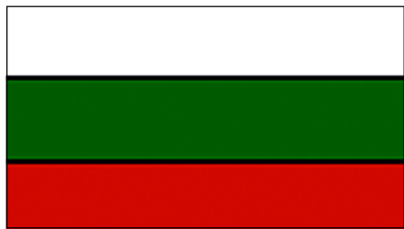
Государственный флаг Болгарии (22.11.1990)

25 ноября 1990 г. страна была провозглашена Республикой Болгария, а