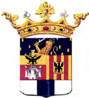
Герб Антверпена (1830)