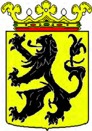
Герб Восточной Фландрии

Упрощенный неофициальный флаг желто-красный полосатый.