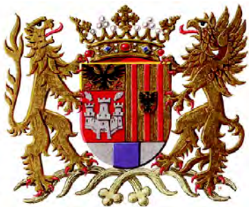
Большой герб Антверпена (XX в.)

БРАБАНТ. Герб: в черном поле золотой бросающийся лев с красным вооружением. Это древний герб герцогства Брабант, известный с XII в. Он происходит от герба основателя герцогства – Готтфрида, графа фон Лёвен, который с 1105 г. был герцогом Лотарингии.