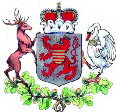
Малый и большой герб Лимбурга