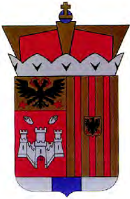
Современный герб Антверпена