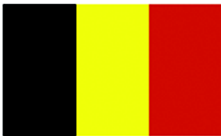
Флаг Соединенных штатов Бельгии (1790) и Бельгии (12.10.1831)

Восстание переросло в революцию, а с 23 по 27 сентября 1830 г. проходили кровавые уличные сражения. 30 сентября 1830 г. созданное Временное правительство утвердило флаг Бельгии, под которым 4 октября 1830 г. была провозглашена независимость страны. Флаг состоял из трех горизонтальных полос: красной, желтой и черной.