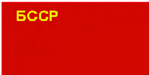
Вариант флага БССР (1925–19.02.1937)

ном полотнище флага в левом верхнем углу у древка помещались золотые серп и молот, над ними – красная пятиконечная звезда, обрамленная золотой каймой, под серпом и молотом – золотые буквы «БССР». В описании указано, что отношение ширины флага к его длине – 1 : 2.