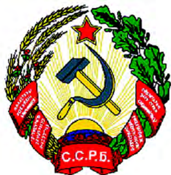
Герб БССР (30.03.1927)

Но ЛитБел просуществовала недолго – уже в марте 1919 г. территорию Литвы оккупировали кайзеровские войска и в конце лета 1919 г. советская власть в Литве была сверг-