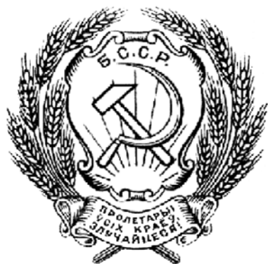
Реконструкция герба БССР (1919)

с Литвой в одну советскую республику. Это решение было озвучено 4 февраля 1919 г. на съезде Советов Беларуси и 15 февраля 1919 г. на съезде Советов Литвы. 27 февраля 1919 г. в Вильне состоялось объединенное заседание ЦИКов Литвы и Беларуси, на котором было принято постановление об объединении этих двух республик в одну – Литовско-Белорусскую Социалистическую Республику. На этом же заседании был рассмот-