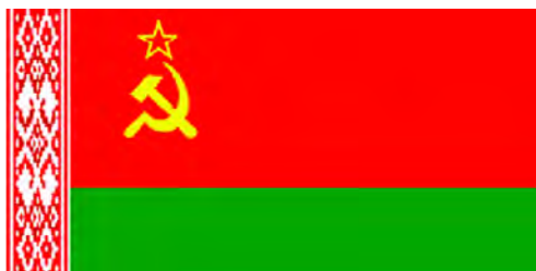
Флаг БССР (25.12.1951–19.09.1991)