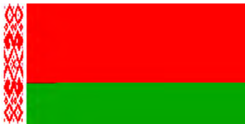
Государственный флаг Республики Беларусь (с 07.06.1995)