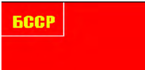
Вариант флага БССР (1925–19.02.1937)