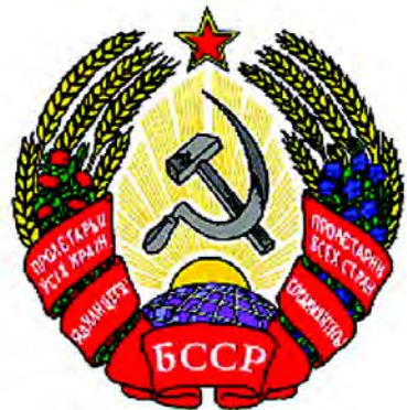
Герб БССР (21.02.1958)

14 мая 1995 г. вопрос о государственной символике был вынесен на республиканский референдум. На основании результатов референдума 7 июля 1995 г. Президент Республики Беларусь издал Указ № 213 «Об утверждении эталона Государственного герба Республики Беларусь и Положения о Государственном гербе Республики Беларусь», вступивший в силу со дня опубликования. Согласно Ука-