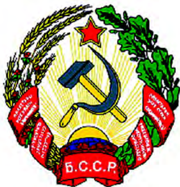
Герб БССР (5.04.1937)

11 апреля 1927 г. 8-й Всебелорусский съезд принял новую редакцию Конституции республики. В статье 74 Конституции записано, что герб представляет собой серп и молот в лучах солнца, окруженных венком; правая часть венка – пучок колосьев, левая – дубовая ветка. Над нижней частью венка – верхняя часть земного шара. Красная лента дважды обвивает каждую половину венка, на правых витках надпись «Пролетарии всех стран, соединяйтесь!» на белорусском и еврейском языках, на левых – на русском и польском. Вверху, над серпом