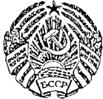
Герб БССР (29.11.1938)

и молотом, изображение пятиконечной звезды; внизу венка надпись «БССР».