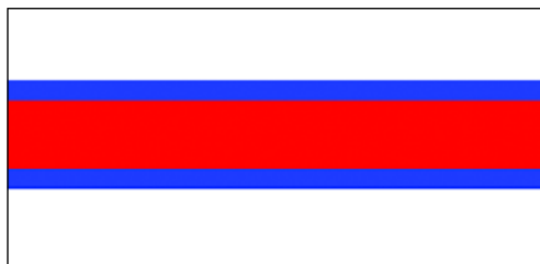
Флаг Рады БНР в Вильне (1919–1925) (реконструкция Л. Спаткая)

На черно-белом фотоснимке периода 1919–1925 гг., когда правительство БНР находилось в эмиграции в Вильне, центральная полоса бело-красно-белого Государственного флага имеет кайму из узких полосок более темного цвета, шириной примерно в 1/16 самого флага. Высказывались предположения, что цвет этих полосок – черный – в знак траура о Родине, где установилась большевистская власть. Но более правдоподобно, что полоски