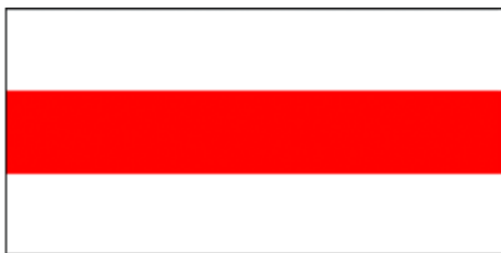
Государственный флаг Республики Беларусь (19.09.1991)

14 мая 1995 г. референдум состоялся. На основании результатов референдума, 7 июня 1995 г. Президент Республики Беларусь издал два указа: № 213 «Об утверждении эталона Государственного герба Республики Беларусь и Положения о Государственном гербе Республики Беларусь» и № 214 «Об утверждении Положения о Государственном флаге Республики Беларусь», которые вступили в силу в день их опубликования. Согласно указа № 214 флаг Республики Беларусь представляет собой прямоугольное полотнище, которое состоит из двух горизонтально расположенных цветных полос: верхней – красного цвета шириной в 2/3 и нижней – зелёного