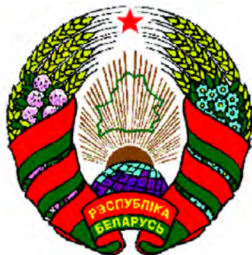
Государственный герб Республики Беларусь (с 07.06.1995)