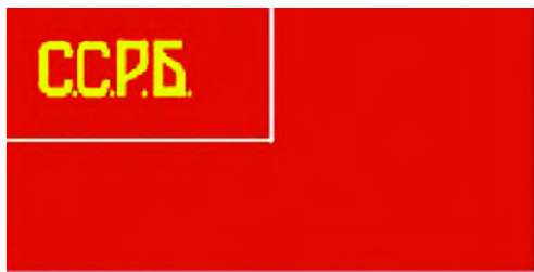
Флаг ССРБ (3.02–27.02.1919 и 31.07.1920–1925)