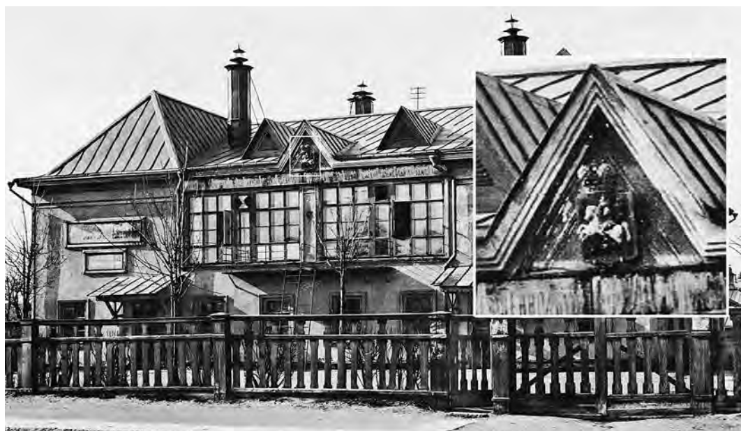
Ил. 8. 2-е Серпуховское женское начальное училище (1910–1914). Фотография.