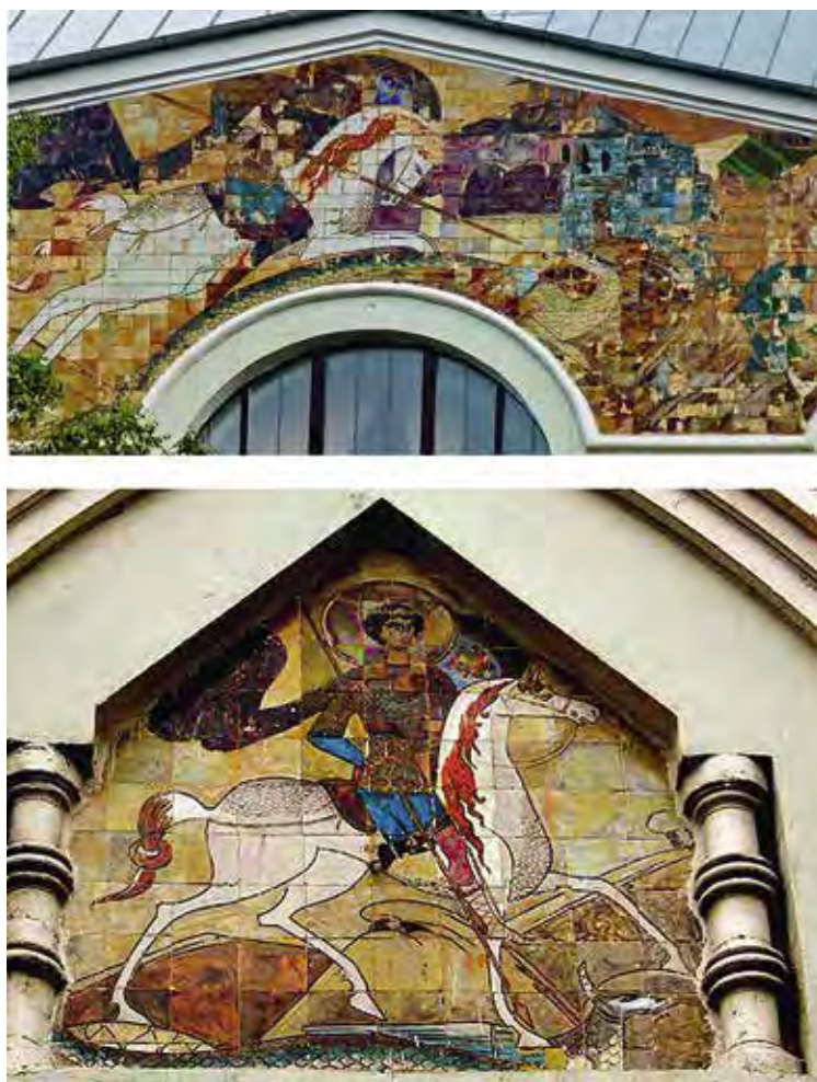
Ил. 11. Майоликовые панно, сюжет которых создан по мотивам герба города Москвы: битва святого Георгия Победоносца – патрона Москвы со Змием.

Также герб в той или иной форме был обнаружен на десяти из сорока восьми зданий больниц и на восьми из тридцати трех домов общественного призрения. Приют для вдов и сирот русских художников имени П. М. Третьякова в Лаврушинском переулке