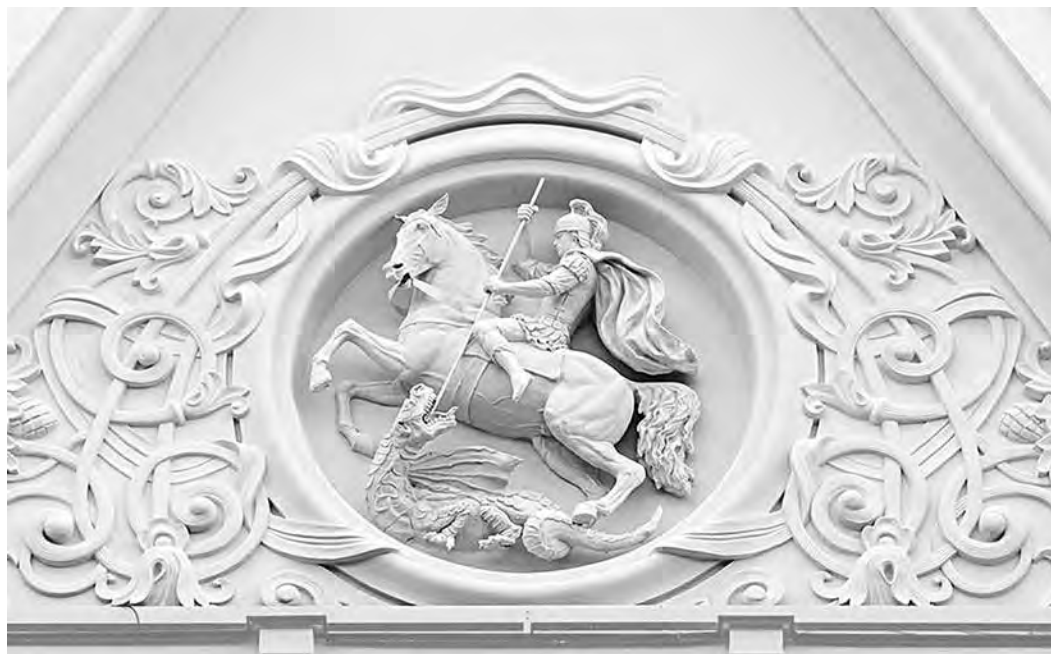
Ил. 2. Отреставрированный барельеф «Георгий Победоносец» на фасаде северного крыла Политехнического музея. Фотография. 2019. Архив автора

слово «герб», и на фасаде отреставрированного Политехнического музея появился барельеф Георгия Победоносца в обновленном виде, позиционирующий как возвращенный (ил. 2).