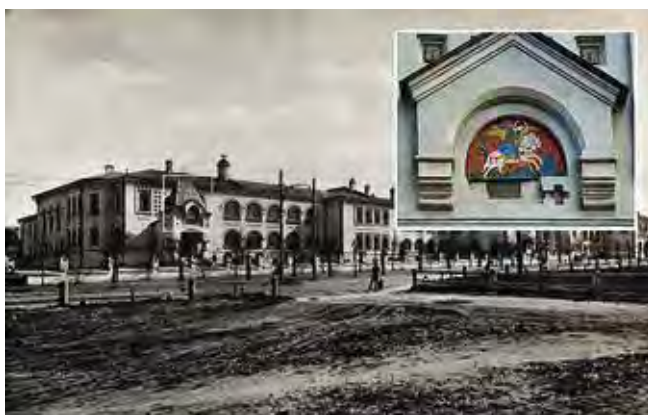
Ил. 13. Комплекс благотворительных учреждений имени Ивана и Александры Медведниковых на Большой Калужской улице (1903–1908). Фотография. Из: Альбом зданий, принадлежащих Московскому городскому общественному управлению. М., 1910. С. 69. На фрагменте: панно в настоящее время. Фотография из архива автора