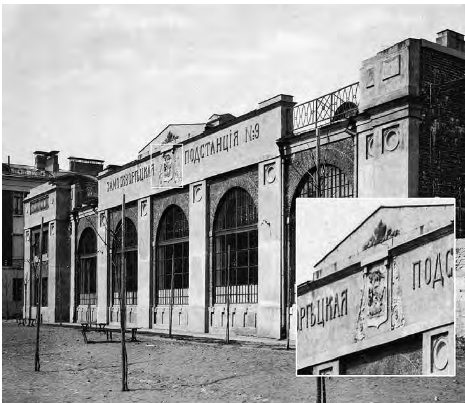
Ил. 17. Замоскворецкая электрическая подстанция городских железных дорог (1909–1910). Фотография. Из: Альбом зданий, принадлежащих Московскому городскому общественному управлению. М., 1910. С. 169

имела не городское, а государственное обеспечение, так как на некоторых изображениях просматривается двуглавый орел. Это предстоит выяснить. Также гербов не обнаружено на зданиях железнодорожных парков города, водонапорных и канализационных зданиях, при этом электрические подстанции, как и городские ломбарды, «помечены» полными гербами (ил. 17, 18). Видимо, это было связано с высоким значением данных учреждений для города. К сожалению, из этих зданий до нашего времени дошли далеко не все, герб по известным причинам не сохранился ни на одном, а образ святого Георгия Победоносца можно увидеть только на некоторых.