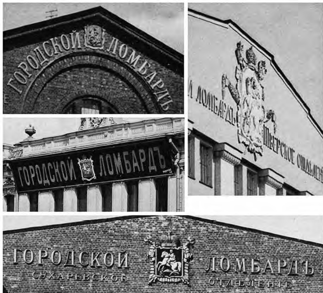
Ил. 18. Городские ломбарды. Фотография. Из: Альбом зданий, принадлежащих Московскому городскому общественному управлению. М., 1910. С. 198–202

а вот здания, связанные с финансами (ломбарды), помечались в обязательном порядке. Такое же исключение делалось и для электростанций, вероятно, ввиду некоторой новизны отрасли и ее связью непосредственно с городским коммунальным хозяйством.