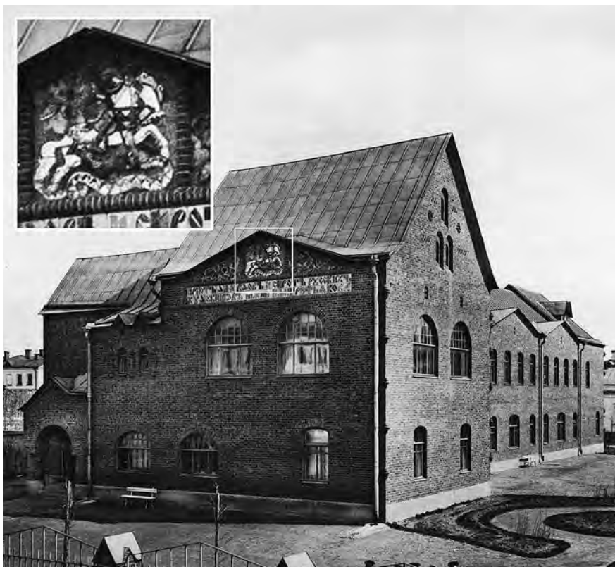
Ил. 12. Приют для вдов и сирот русских художников имени П. М. Третьякова, Лаврушинский переулок (1912). Фотография.