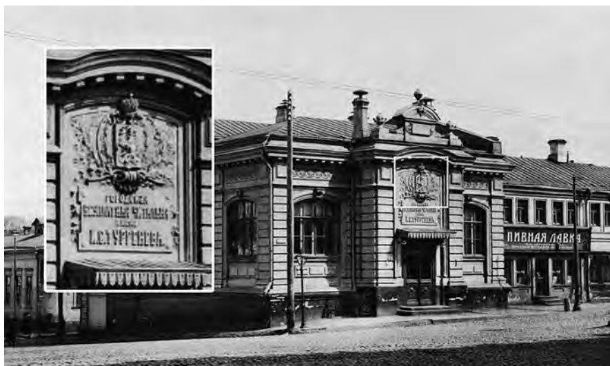
Ил. 16. Библиотека-читальня имени Ивана Сергеевича Тургенева (1885). Фотография. Из: Альбом зданий, принадлежащих Московскому городскому общественному управлению. М., 1910. С. 51