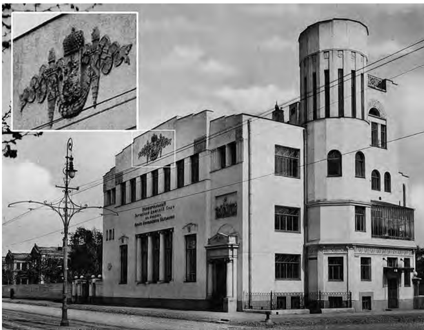
Ил. 9. Универсальный детский сад памяти Ольги Кельиной (1911). Фотография.