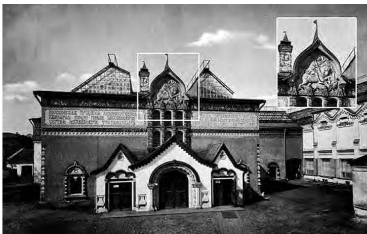
Ил. 14. Главный фасад Государственной Третьяковской галереи, Лаврушинский переулок (1906). Фотография. Из: Альбом зданий, принадлежащих Московскому городскому общественному управлению. М., 1910. С. 53

Любопытно, что, например, ни на одном из девятнадцати полицейских домов нет герба города, как и на девяти представленных в альбоме фотографий казарм. Отсутствие гербов на учреждениях полиции, казармах, скорее всего, связаны с существованием развитой собственной ведомственной символики. Кроме того, большая часть из них