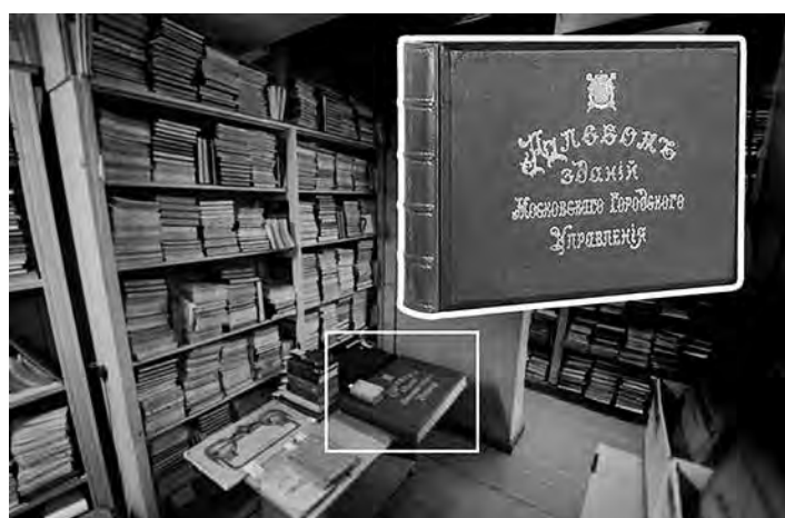
Ил. 4. Находки в Политехническом музее. На фрагменте: «Альбом зданий, принадлежащих Московскому городскому общественному управлению» (М., 1910)