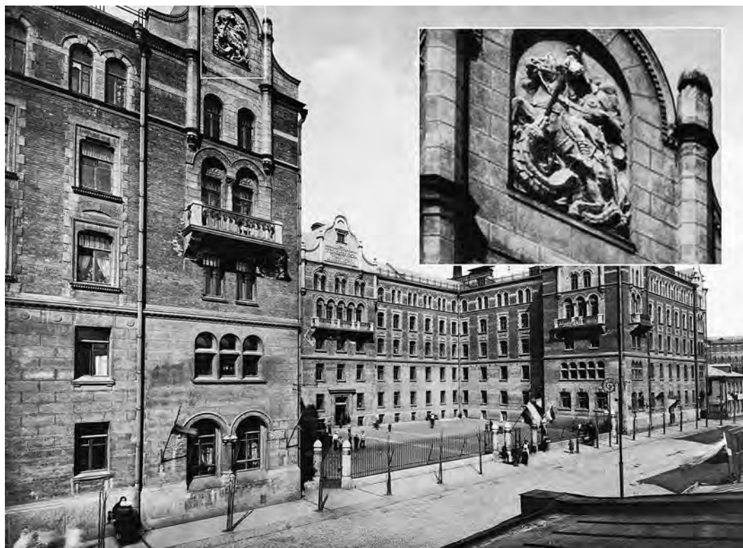
Ил. 15. Дом дешевых квартир «Свободный гражданин» Г. Г. Солодовникова на 2-й Мещанской улице (1909). Фотография. Из: Альбом зданий, принадлежащих Московскому городскому общественному управлению. М., 1910. С. 126