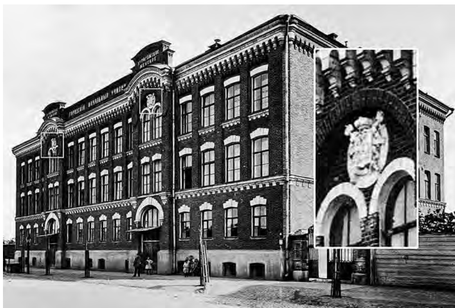
Ил. 6. Училищное здание им. Гоголя на Б. Александровской улице (1902). Фотография. Из: Альбом зданий, принадлежащих Московскому городскому общественному управлению. М., 1910. С. 19