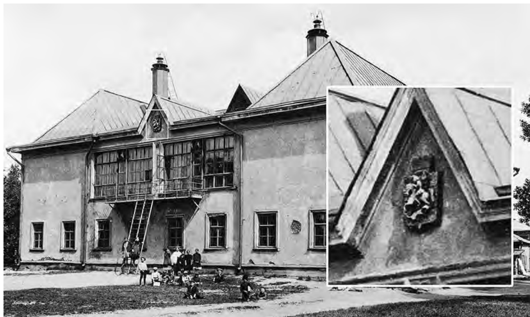
Ил. 7. Здание 1-х Сокольнических мужского и женского училищ (1913–1914). Фотография. Из: Альбом зданий, принадлежащих Московскому городскому общественному управлению. М., 1910. С. 31