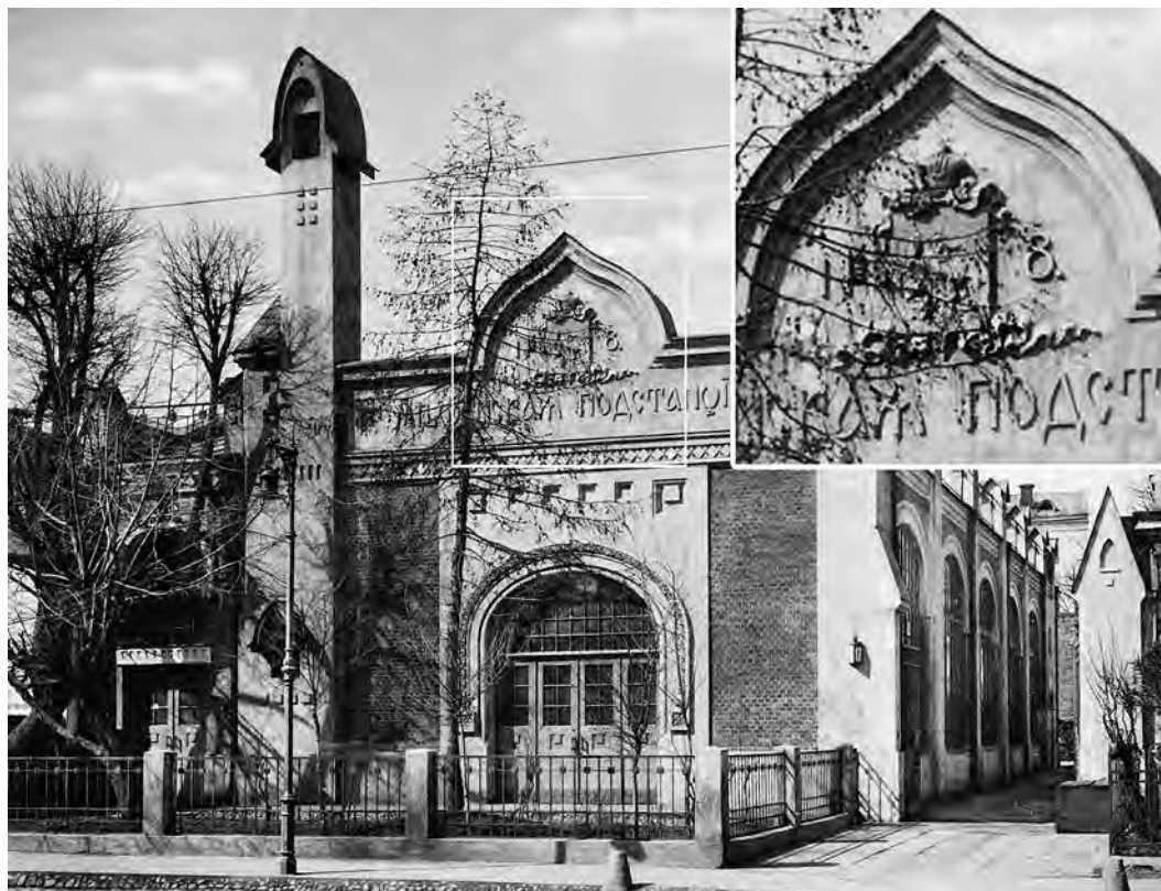
Ил. 3. Мещанская электрическая подстанция городских железных дорог (1907–1911). Фотография. Из: Альбом зданий, принадлежащих Московскому городскому общественному управлению. М., 1910. С. 171