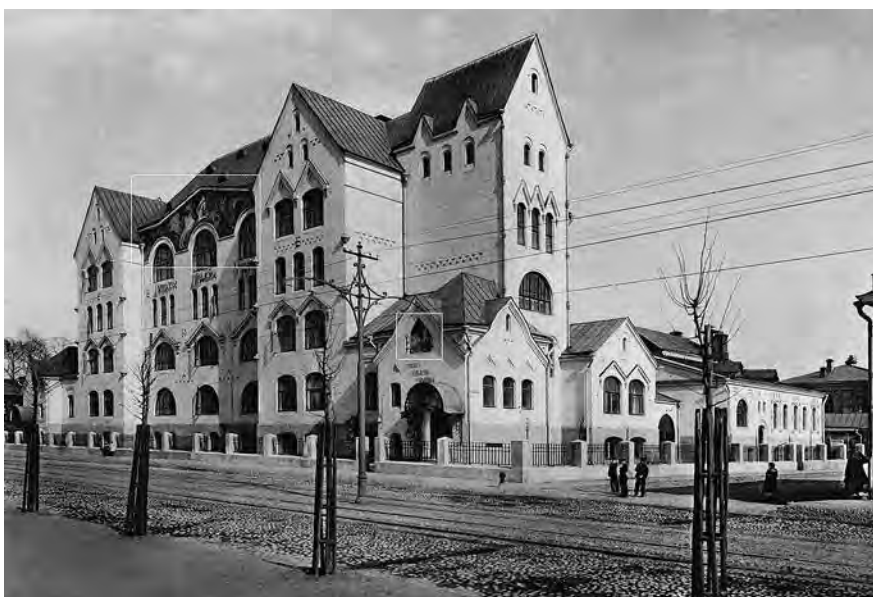
Ил. 10. Дом Городских начальных училищ по улице Большая Пироговская, 9А, строение 1 (1902–1908). Фотография.