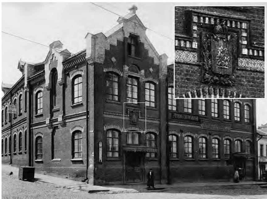
Ил. 5. 3-е Рогожское мужское начальное училище им. А. В. Алексева на Николо-Ямской улице (1884). Фотография.