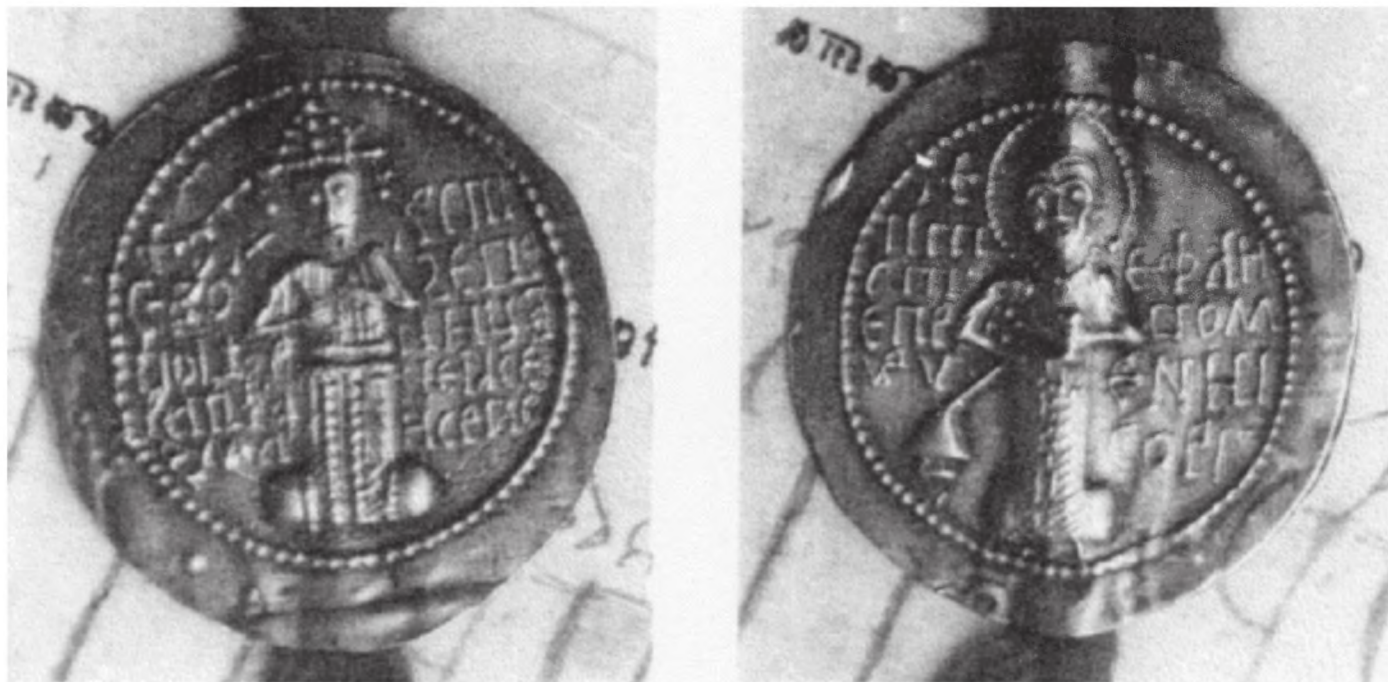
Рис. 2 1 . Золотая булла сербского короля Стефана Душана (лицевая и оборотная стороны)