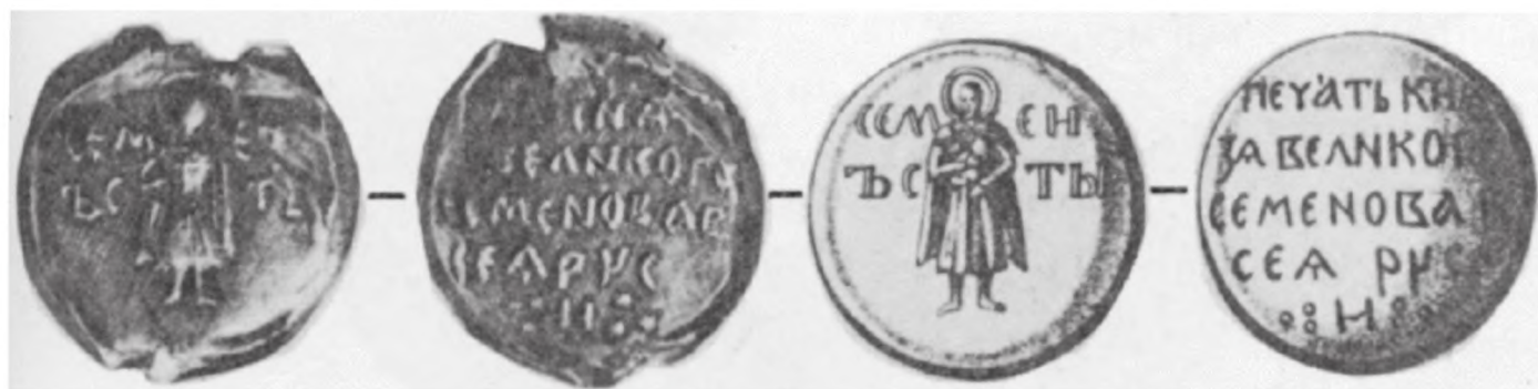
Рис. 2 2 . Позолоченный аргировул Симеона Ивановича Гордого (лицевая и оборотная стороны, профисовка)

(у Ивича — 1350 г.) и аналогичной печати Симеона Гордого, привешенной к его духовной грамоте 1353 г. 49 Вместо греческого «агиос» здесь рядом с фигурой святого имеется надпись: «семен с(вя)ты». На печати царя Стефана Душана 50 — «стефане првомучени(к)». Хотя лицевые стороны печатей различны (на печати Стефана Душана — изображение стоящего царя в короне и царском одеянии, а на печати Симеона Гордого — строчная надпись), их сближает легенда, упоминающая в титуле «все земли српске» и «всея Руси».