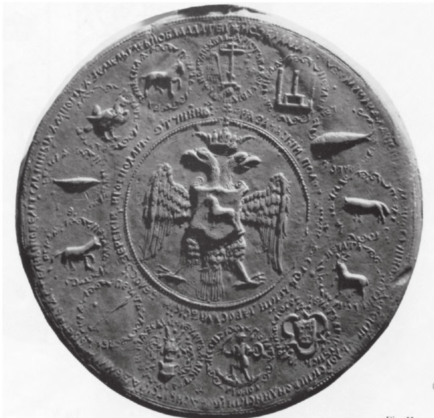
Рис. 16. Печать Ивана IV Васильевича, 1577 г. (оборотная сторона)

жающего копьем дракона, имеется комплекс новых изображений 2 . Немецкий ученый Г. Штёкль впервые попытался интерпретировать данную печать как памятник, отражающий концепцию государственной власти Ивана IV 3 . Он считает, что в плане выяснения взглядов Ивана IV на власть и государство печать не уступает по своему значению знаменитой полемической переписке царя с Курбским. Автор подверг анализу изобразительные компоненты печати. Методическая непоследовательность автора, которая, с одной стороны, привела к выводу о случайном характере отдельных элементов композиции, с другой — к определенной изолированности при рассмотрении сюжетки эмблем (несоотнесение их с титулом царя, с письменными свидетельствами и т. д.), делает, в частности, ма-