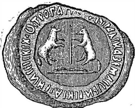
Печать Енисейского острога, приложенная к грамоте 1671 г.