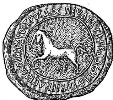
Печать Красноярского острога, приложенная к грамоте 1644 г.