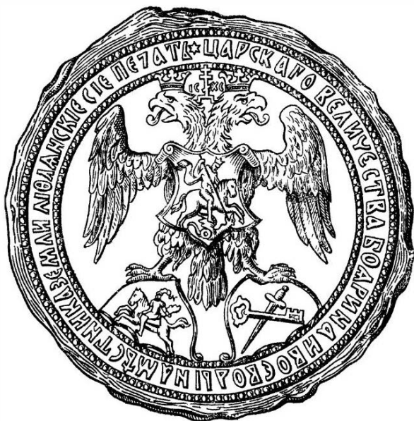
Печать царского наместника в Ливонии 1564 г.

двум эмблемам, казалось бы не имеющим непосредственного отношения к теме нашей книги. Во-первых, прослеживая историю их появления и существования, можно хорошо себе представить, как из эмблем постепенно рождается герб. Во-вторых, в некоторых городских гербах (речь о них пойдет ниже) присутствует российский государственный герб или его часть. Откуда берет начало его символика? Читатель теперь осведомлен об этом.