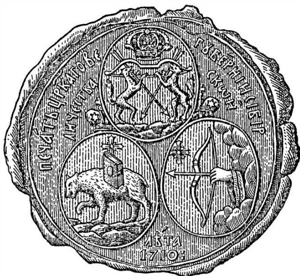
Печать Сибирской губернии. 1710 г.

система размещения полков петровской армии. Повлиял этот процесс и на развитие городской символики. В 1708 г. Россия была разделена на восемь губерний с приписанными к ним городами. Каждая губерния содержала свои полки. Внутри губерний полки размещались по городам и почти все получили названия городов, некоторые — губерний. А вместе с названиями полки получили и эмблемы городов, областей, которые изображались на полковых знаменах.