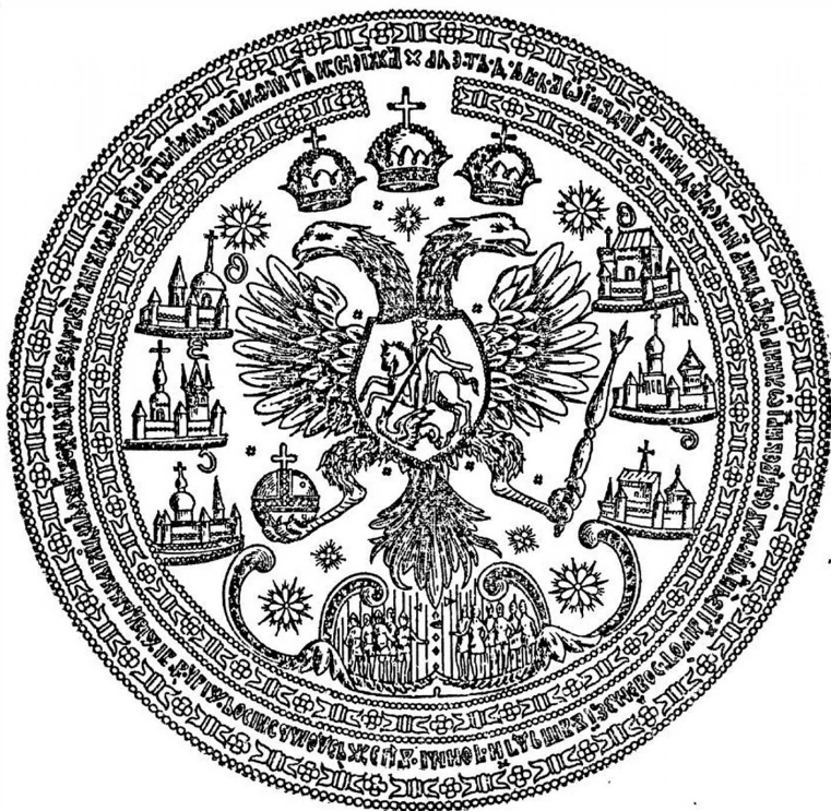
Государственная печать Алексея Михайловича

лечение гербами. В упомянутом Титулярнике был записан полный государев титул. Он сопровождался миниатюрами, оформленными в виде гербов территорий — 33 герба царств, княжеств и земель, названия которых входили в царский титул (см. вклейки). Можно ли их назвать гербами? Видимо, лишь условно; скорее, это рисунки эмблем. Стилизация, присущая гербу, в них отсутствует, нарушается традиционная геральдическая ориентация фигур, геральдическая цветовая гамма. Есть и другая причина не считать эмблемы Титулярника гербами: они не выражали автономии областей и не олицетворяли их самоуправления. Тем не менее создатели Титулярника считали их гербами, что не очень противоречило общему взгляду на гербы во всей Европе, где распространилась «бумажная геральдика» и начинают возникать один за