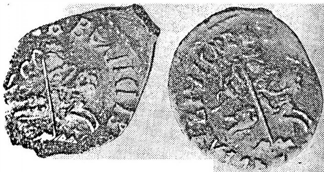
Изображение всадника, поражающего копьём дракона, на монетах Ивана III

мечом или соколом. Монеты с подобными сюжетами чеканили великие князья Твери, Москвы, князья, владеющие уделами (в княжествах Городенском, Кашинском, Галицком, Серпуховском, Можайском, Верейском, Дмитровском).