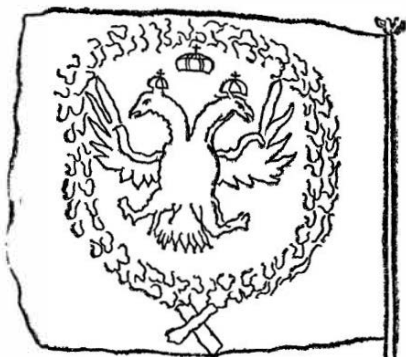
Рисунки флагов из записной книжки Петра I