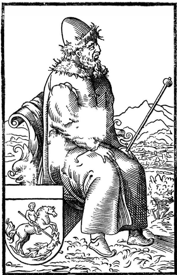
Изображение герба Русского государства рядом с портретом Василия III

туду, когда Владимир, монарх расийски, свою империю разделил 12 сынам своим, из которых Владимирские князи возымели себе сей герб с. Егория, но потом ц. Иван Ва., когда монархию, от деда его собранную, паки утвердил и короновался, тогда орла за герб империи росической принял, а княжеской герб в груди оного поставил». Здесь проводится мысль об исконности существования русской