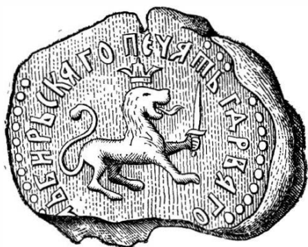
Печать Симбирска под выписью с переписных и отказных книг 1695 г.

С 1712 г. повые знамена стали изготовляться в Оружейной палате и отсюда рассылаться в полки (см. вклейку). В качестве городских эмблем использовались уже известные, а также вновь созданные. Кроме шестнадцати эмблем Титулярника и отраженных в дневнике Корба (напомним: киевская, владимирская, астраханская, новгородская, псковская, вятская, пермская, нижегородская, рязанская, казпская, сибирская, тверская, ростовская, ярославская, черниговская, смоленская), на новых знаменах изображаются эмблемы полков: Новотроицкого, Троицкого, Архангелогородских, Ингерманландских, Вологодских, Белогородского, Воронежского, Симбирского, Каргопольского, Тобольских, Шлиссельбургского, Невских, Нарвских, Азовских, Луцких, Бутырского, Лефортовского, Саксонского, Санкт-Петербургского, Галицкого,