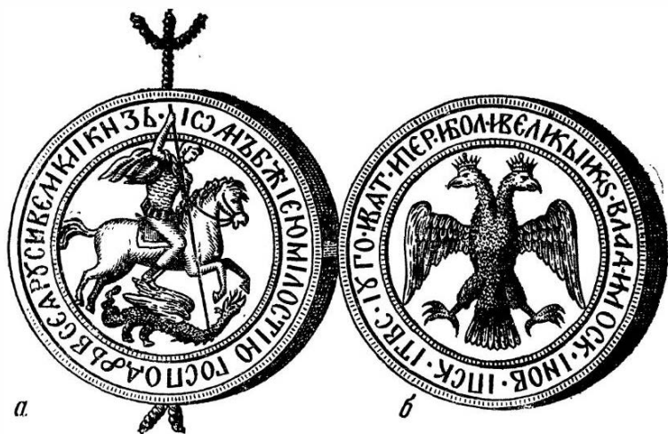
Государственная печать Ивана III:

а — лицевая сторона; б — оборотная сторона