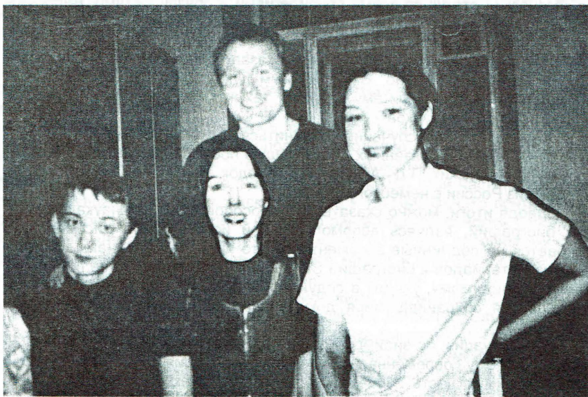
В кругу семьи