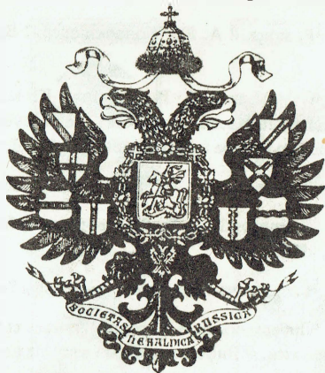
Проектъ № 1

"Черный двуглавый орёлъ, увѣнчанный Шапкой Мономаха съ развѣвающимися концами ленты андреевскаго ордена. Въ лапахъ лента съ названіемъ Общества на латыни: SOCIETAS HERALDICA RUSSICA. На груди орла гербъ Московскій. Вокругъ щита цѣпь ордена св. Апостола Андрея Первозваннаго. На крыльяхъ золотые щитки различной конфигураціи (по четыре на каждомъ крылѣ) съ цвѣтными главными геральдическими фигурами: перевязью, крестомъ, поясомъ и столбомъ".