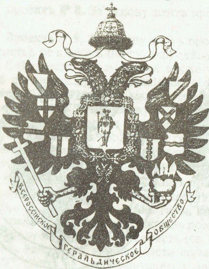
Проект № 4