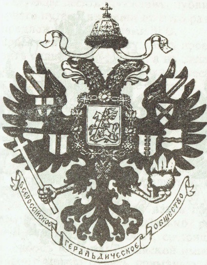
Проект № 2