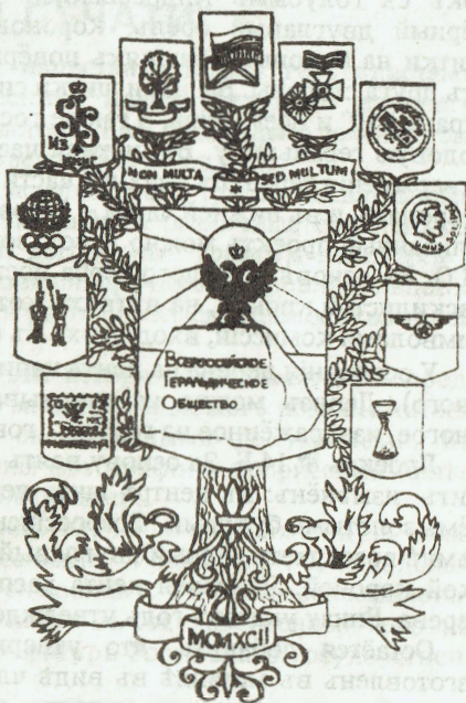
Проект № 14-Б