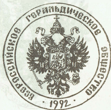
Проект № 9