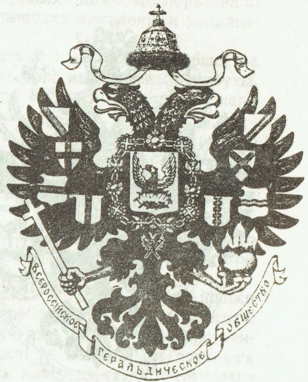
Проект № 3