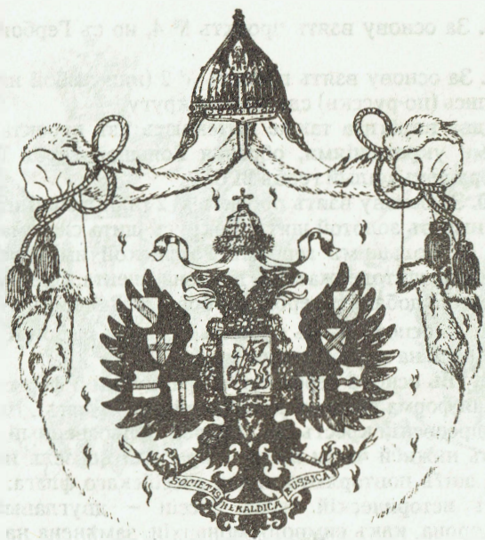
Проектъ № 11