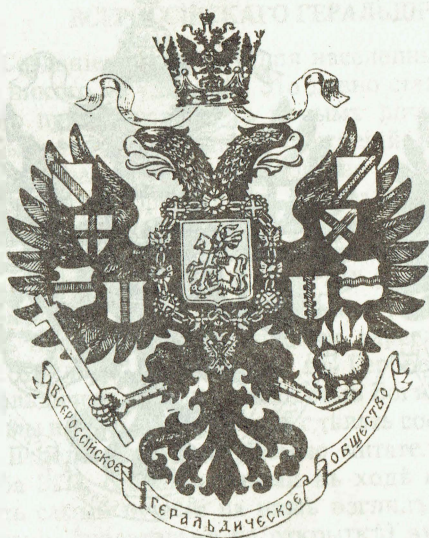
Проект № 6