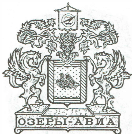
МУП "Озёры-авиа" ГМ 756 от 26.06.2003 г.