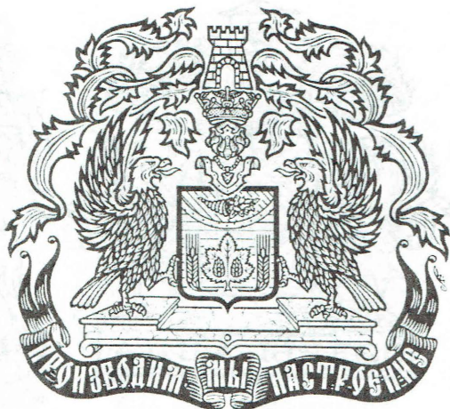
Московский пиво-безалкогольный комбинат "Очаково" ГМ 673 от 19.03.2002 г.