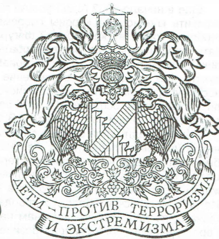
Благотворительный фонд "Дети - против терроризма и экстремизма" ГМ 698 от 01.07.2002 г.