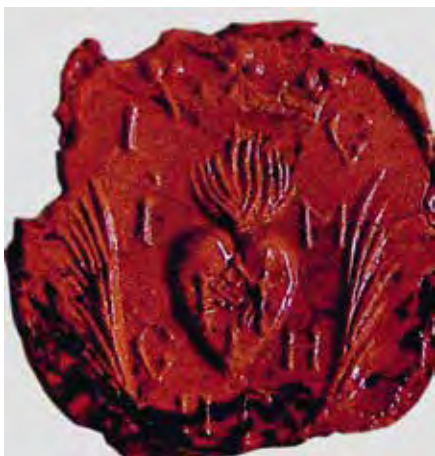
Ил. 12. Печать с гербом игумена Сильвестра. Воспроизводится по: Ситий І. Козацька Україна: печатки, герби, знаки та емблеми кінця XVI – XVIII століть. Київ, 2017. С. 778