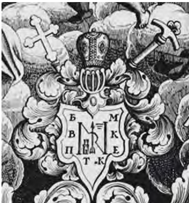
Ил. 23. Герб Варлаама Косовского. Фрагмент гравюры. Воспроизводится по: Ровинский Д. А. Материалы для русской иконографии. Вып. 9. СПб., 1890. Л. 348