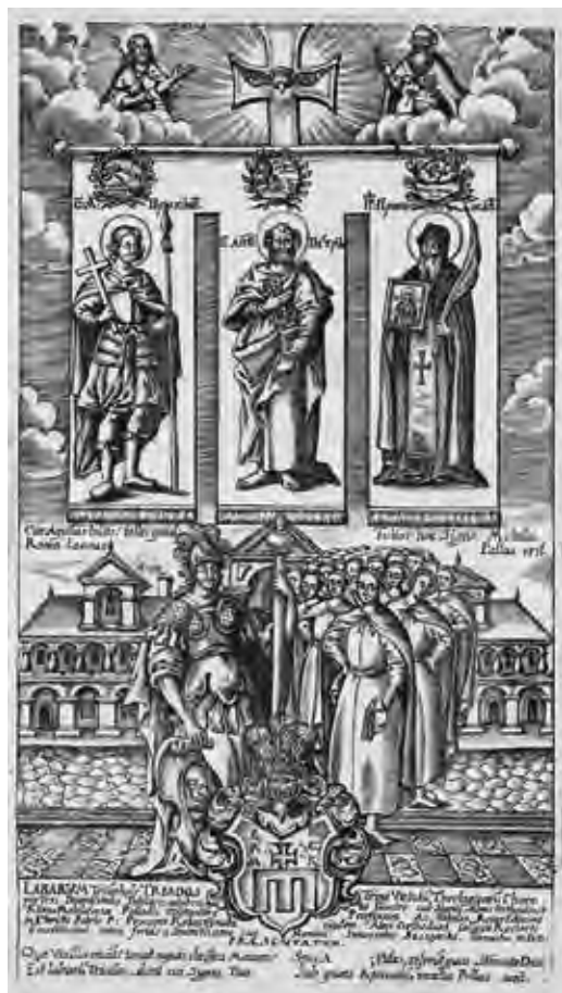
Ил. 20. Гравюра с гербом Прокопия Калачинского.

Особого внимания заслуживают Иннокентий Гизель (1600–1683), архимандрит Киево-Печерской лавры (1656–1683), с его самобытным гербом, содержащим митру, посох, жезл и гвоздь (ил. 27); Амвросий Зертис-Каменский (1708–1771), архимандрит Новоиерусалимского монастыря (с 1748), архиепископ Московский (с 1768), пятичастный герб которого достоин отдельного рассмотрения, а здесь мы его вынуждены опустить из-за низкого качества изображения; Исайя Копинский (ум. 1634), из шляхты герба Любич,