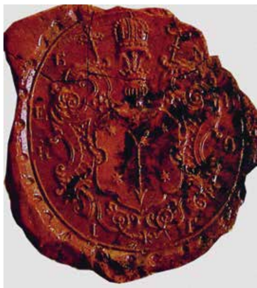
Ил. 24. Печать с гербом Иоасафа Горленко.