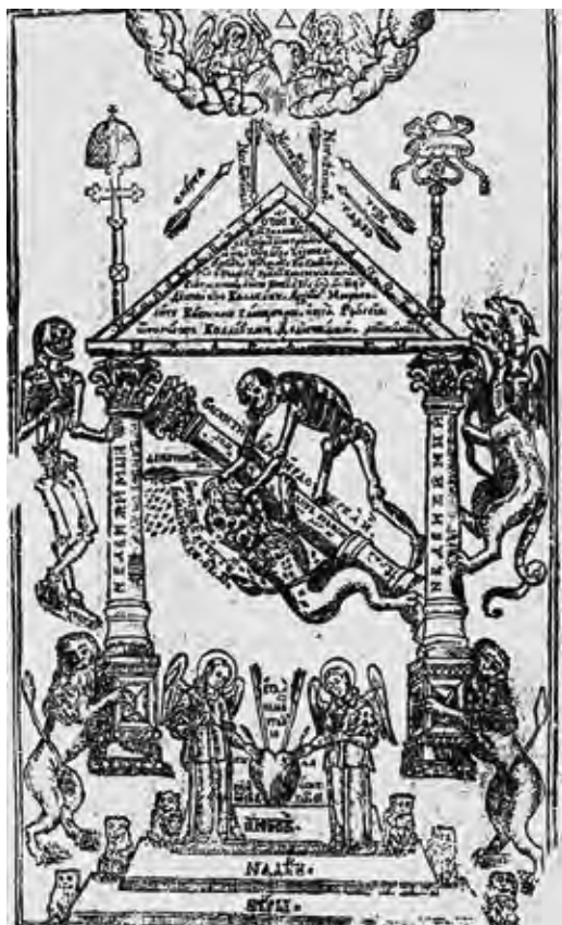
Ил. 26. Гравюра с гербом Сильвестра Коссова. Воспроизводится по: Столп ясне превелебному, его милости, отцу Сильвестру Коссову... Киев, 1658. Титульный лист

На этом мы и остановимся, чтобы, как я надеюсь, со временем вернуться к наиболее интересным вопросам этой темы.