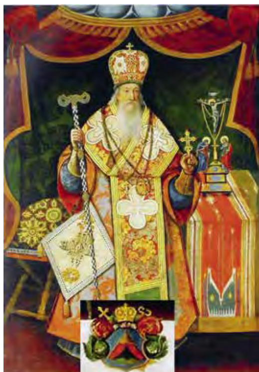
Ил. 18. Портрет Иоасафа Кроковского. Воспроизводится по: Украинський портрет XVI–XVIII століть : каталог-альбом. Київ, 2006. С. 172. Фрагмент с гербом увеличен