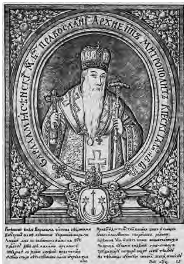
Ил. 14. Портрет Варлаама Ясинского с гербом. Воспроизводится по: Ровинский Д. А. Материалы для русской иконографии. Вып. 1. СПб., 1884. Л. 35

(с 1690) (ил. 14); Стефан Яворский (1658–1722), митрополит Рязанский и Муромский (с 1700); президент Духовной коллегии (Святейшего синода) (с 1721) (ил. 15).