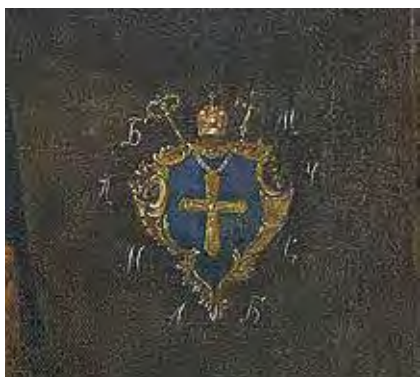
Ил. 13. Герб Лазаря Барановича. Фрагмент портрета. Воспроизводится по: Український портрет XVI–XVIII століть : каталог-альбом. Київ, 2006. С. 180