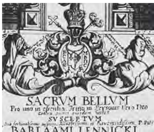
Ил. 22. Герб Варлаама Леницкого. Фрагмент гравюры. Воспроизводится по: Ровинский Д. А. Материалы для русской иконографии. Вып. 9. СПб., 1890. Л. 350