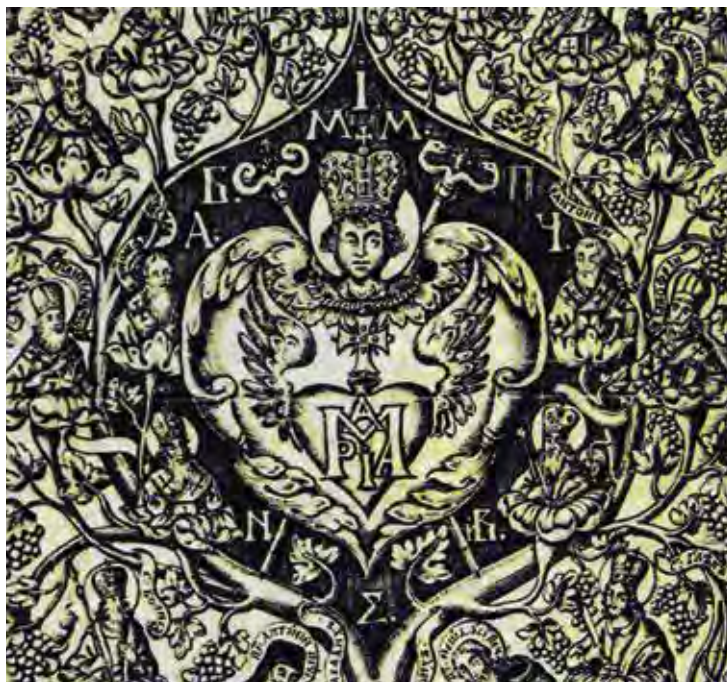
Ил. 10. Герб Иоанна Максимовича. Фрагмент гравюры из издания: Зерцало от писания Божественного . Чернигов, 1705.