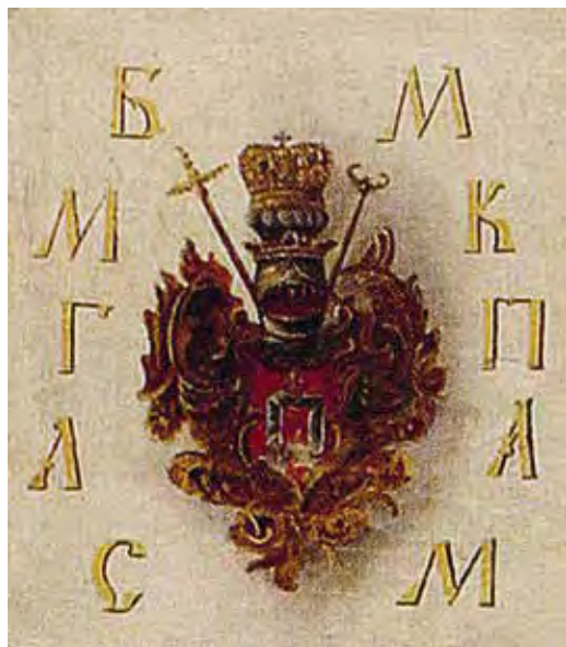
Ил. 21. Герб Самуила Мыславского. Фрагмент портрета. Воспроизводится по: Український портрет XVI–XVIII століть: каталог-альбом. Київ, 2006. С. 177

Особого внимания заслуживают Иннокентий Гизель (1600–1683), архимандрит Киево-Печерской лавры (1656–1683), с его самобытным гербом, содержащим митру, посох, жезл и гвоздь (ил. 27); Амвросий Зертис-Каменский (1708–1771), архимандрит Новоиерусалимского монастыря (с 1748), архиепископ Московский (с 1768), пятичастный герб которого достоин отдельного рассмотрения, а здесь мы его вынуждены опустить из-за низкого качества изображения; Исайя Копинский (ум. 1634), из шляхты герба Любич,