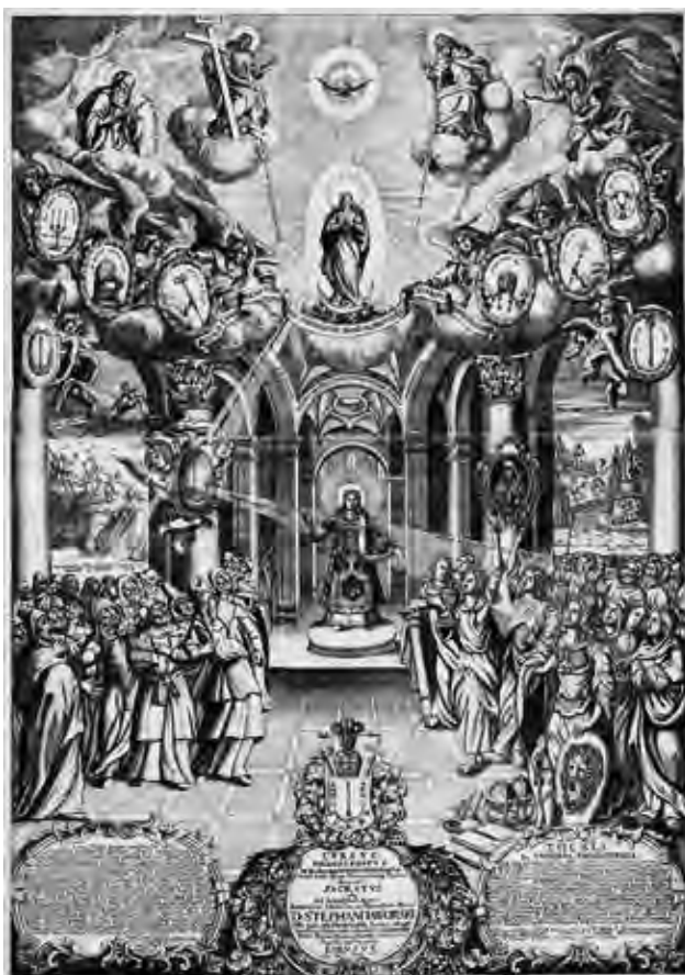
Ил. 15. Гравюра с гербом Стефана Яворского. Воспроизводится по: Ровинский Д. А. Материалы для русской иконографии. Вып. 9. СПб., 1890. Л. 349

(ил. 16); Гедеон Криновский (ок. 1726 – 1763), настоятель Троице-Сергиевой лавры (1758–1761), – у него лилии имеют натуральный вид.