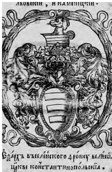
Ил. 3. Герб Гедсона Балабана.

2. Архиереи, которые сохраняли шляхетские гербы, добавляя скрещенные посох и жезл за щитом, а митру – над щитом.