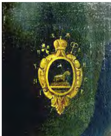
Ил. 17. Герб Иллариона Роголевского. Фрагмент портрета. Воспроизводится по: Украинський портрет XVI–XVIII століть : каталог-альбом. Київ, 2006. С. 175