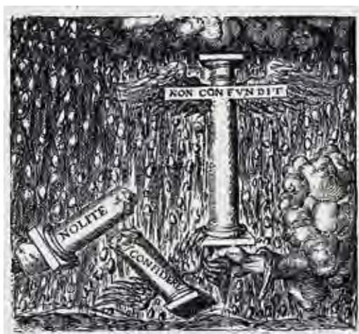
Ил. 25. Эмблема столпа. Воспроизводится по: Montana G. Monumenta emblematum christianorum virtutem... Lyon, 1571. P. 70