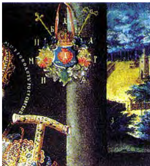
Ил. 9. Герб Димитрия Ростовского. Фрагмент портрета.

Козацька Україна: печатки, герби, знаки та емблеми кінця XVI – XVIII століть. Київ, 2017. С. 477