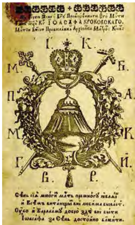
Ил. 19. Герб Намет Иоасафа Кроковского. Воспроизводится по: Копитский II . Алфавит духовный, в пользу иноком и мирским, богоугодне жити хотящим, написанный. Киев, 1710. Оборот титульного листа