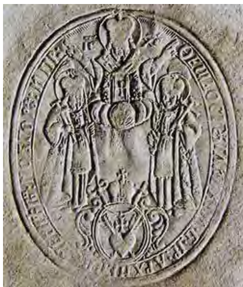
Ил. 8. Печать Феодосия Углицкого с гербом (внизу). Воспроизводится по: Ситий I.

Это окрыленное сердце (у Иоанна Максимовича, Феодосия Полоницкого-Углицкого), пронзенное стрелами страдания (у последнего же), пламенеющее (у игумена