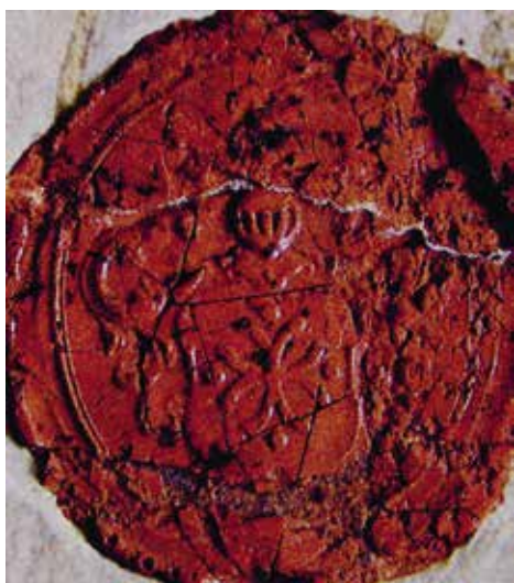
Ил. 4. Печать с гербом Феофилакта Слонецкого. Воспроизводится по: Ситий І. Козацька Україна: печатки, герби, знаки та емблеми кінця XVI – XVIII століть. Київ, 2017. С. 774

3. И самая интересная для нас группа – те, кто осознанно использовали гербовые фигуры, насыщали гербы особым религиозным смыслом. При этом существовавший шляхетский герб мог изменяться, даже до неузнаваемости, вообще конструироваться заново, так, что от собственно родового герба ничего не оставалось.