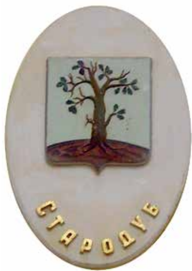
Ил. 22. Герб Стародуба на триумфальной арке в Новгороде-Северском, Украина.