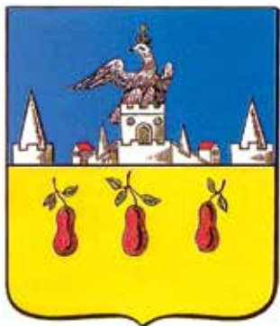
Ил. 16. «Исторический» герб Трубчевска, традиционное изображение