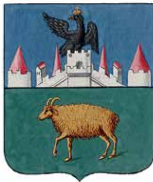
Ил. 13. Герб Лугани, жалованная грамота. Ф. 1411. Оп. 2. Д. 205. Л. 6