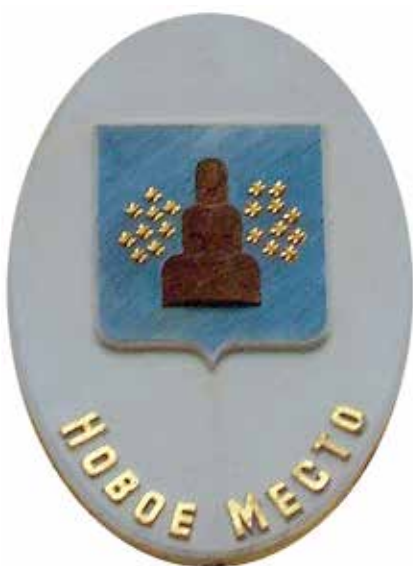
Ил. 24. Герб Нового Места на триумфальной арке в Новгороде-Северском, Украина.