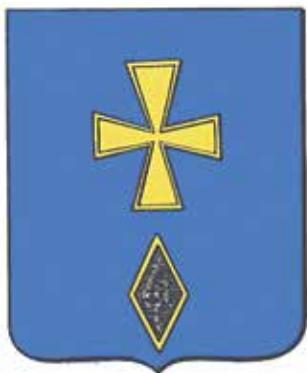
Ил. 26. «Исторический» герб Погара, традиционное изображение