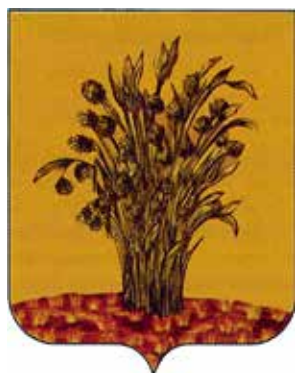
Ил. 18. «Исторический» герб Суража, традиционное изображение