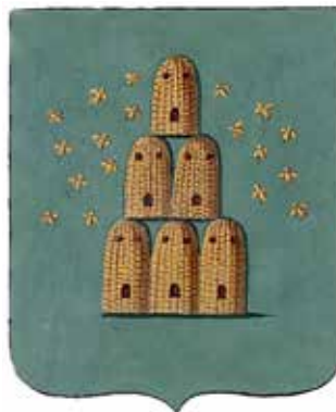
Ил. 9. Герб Нового Места, жалованная грамота.  Ф. 1411. Оп. 2. Д. 190. Л. 6