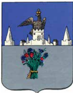
Ил. 14. «Исторический» герб Карачева, традиционное изображение