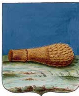
Ил. 11. Герб Севска, жалованная грамота. Ф. 1411. Оп. 2. Д. 208. Л. 6

Описание герба из Знаменного гербовника 1730 года: