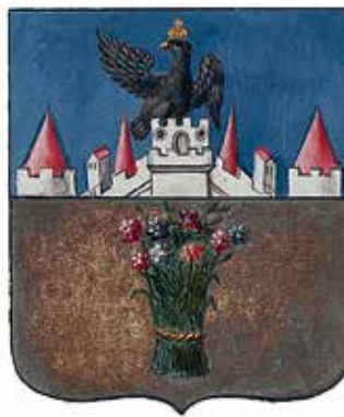
Ил. 15. Герб Карачева, жалованная грамота. © Федеральное казенное учреждение «Российский государственный исторический архив» (РГИА). Ф. 1411. Оп. 2. Д. 202. Л. 6

Как бы то ни было, посмотрим, что в первоисточнике – в жалованной грамоте (ил. 7)? Лазурная полоса есть, но ведь это не окантовка, это такая «туманная даль». Художники, выполнявшие рисунок, просто нарисовали пейзаж с воздушной голубоватой перспективой .