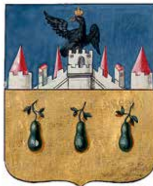
Ил. 17. Герб Трубчевска, жалованная грамота. Ф. 1411. Оп. 2. Д. 209. Л. 6