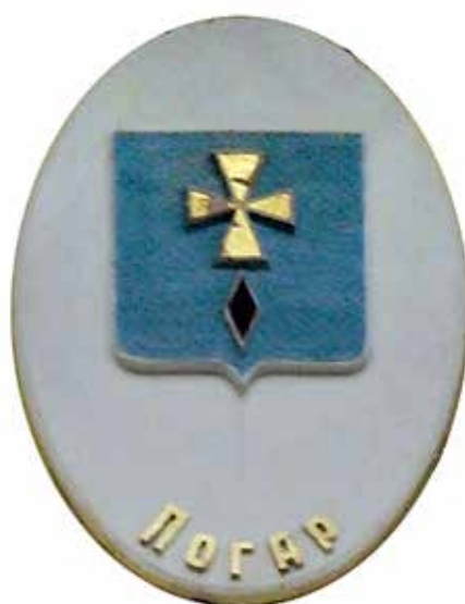
Ил. 23. Герб Погара на триумфальной арке в Новгороде-Северском, Украина.