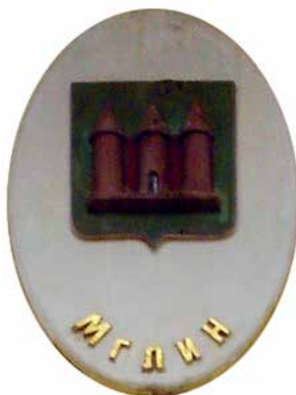
Ил. 25. Герб Мглина на триумфальной арке в Новгороде-Северском, Украина.