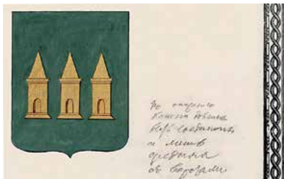
Ил. 30. Жалованная грамота с гербом Мглина и надпись, сообщающая об ошибке. Фрагмент. Ф. 1411. Оп. 2. Д. 189. Л. 6