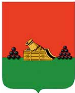
Ил. 1. Герб Брянска, внесенный в Государственный геральдический регистр (2016)