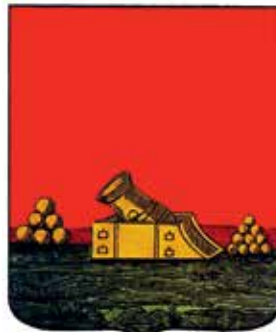
Ил. 4. «Исторический» герб Брянска, традиционное изображение