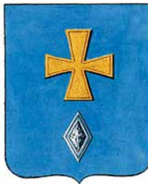
Ил. 27. Герб Погара, жалованная грамота. © Федеральное казенное учреждение «Российский государственный исторический архив» (РГИА). Ф. 1411. Оп. 2. Д. 191. Л. 6