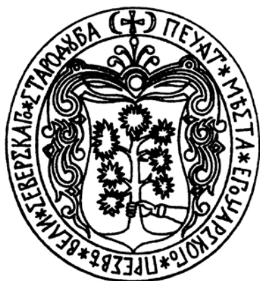
Ил. 31. Печать города Стародуба (1696).