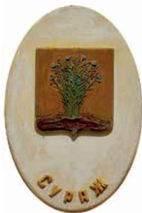
Ил. 20. Герб Суража на триумфальной арке в Новгороде-Северском, Украина.