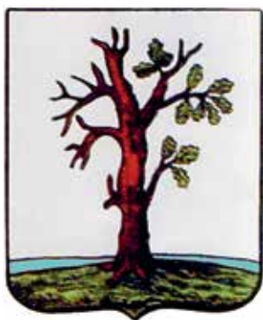
Ил. 5. Герб Стародуба, внесенный в Государственный геральдический регистр (2006)