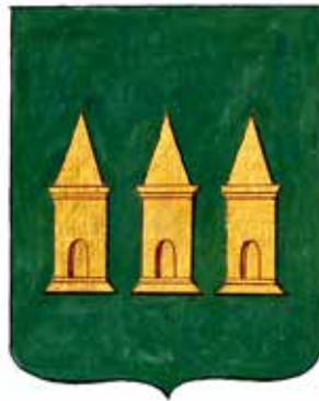
Ил. 29. Герб Мглина, жалованная грамота. © Федеральное казенное учреждение «Российский государственный исторический архив» (РГИА). Ф. 1411. Оп. 2. Д. 189. Л. 6