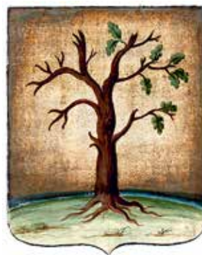
Ил. 7. Герб Стародуба, жалованная грамота. Ф. 1411. Оп. 2. Д. 193. Л. 6