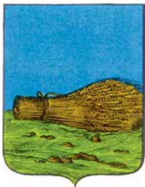
Ил. 10. «Исторический» герб Севска, традиционное изображение