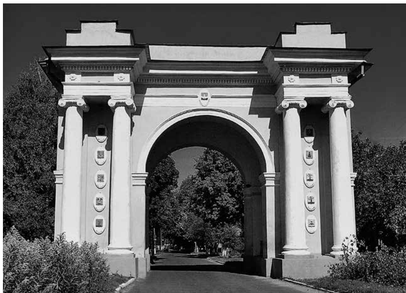
Ил. 21. Триумфальная арка в Новгороде-Северском, Украина. Архитектор Дж. Кваренги, 1786. Фотография автора

Герб Трубчевска (ил. 16, 17): В золотом поле три натурального цвета дули 8 – на рисунке из жалованной грамоты дули 9 зеленые, тогда как традиционно они коричневые, а зеленые у них только листья. Интереснее с гербом Суража : В золотом поле куст созревшей конопля 10 . Здесь тоже «голубая даль».