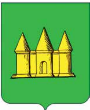
Ил. 28. «Исторический» герб Мглина, традиционное изображение