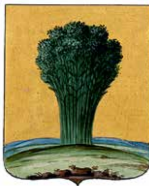
Ил. 19. Герб Суража, жалованная грамота.