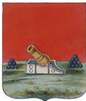
Ил. 3. Герб Брянска, жалованная грамота. Ф. 1411. Оп. 2. Д. 199. Л. 6