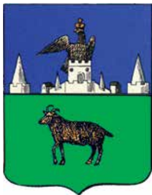
Ил. 12. «Исторический» герб Лугани, традиционное изображение