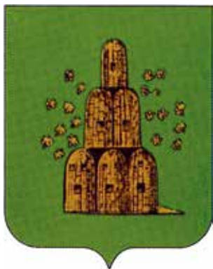
Ил. 8. «Исторический» герб Нового Места, традиционное изображение