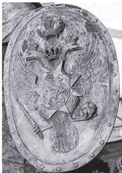
Рис. 1. Фрагмент памятника А.В. Суворову, С.-Петербург. На щите Марса у двуглавого орла четыре короны.

Корона императорского типа, действительно, реально появилась в России при Петре I, и изготовлена она была по образцу корон Священной Римской империи на самом закате его царствования для коронации Екатерины I в 1724 году. Об этом подробно рассказано в разных источниках, например, в сериале «Сокровища Московского Кремля». Сам Петр никогда подобным венцом не венчался. Он и его старший брат в детстве были уже венчаны по старинному обряду. Царевич Иоанн V – исторической шапкой Мономаха, а Петр I – специально для этого изготовленным венцом на подобие шапки Мономаха – так называемой «Шапкой Мономаха второго наряда». И повторно он на себя никакого венца не возлагал. Хотя в более поздних изображениях ему подобный венец и «пририсовывали».