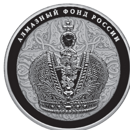
Рис. 3. Коронационный венец Екатерины II (т.н. «Большая императорская корона Российской империи») на серебряной монете Банка России, 2016 г. (№5115-0125, 25 руб., Ø 60 мм)