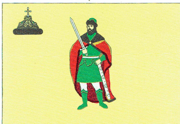
Герб и флаг Рязани. Рисунок М.К. Шелковенко.