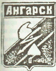
Герб Ангарска 1969 г.