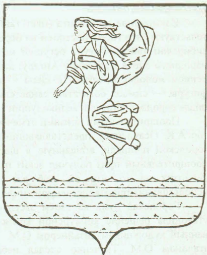
Окончательный вариант герба г. Ангарска, утвержден 29 апреля 1996 г. Художник О.М. Ткаченко