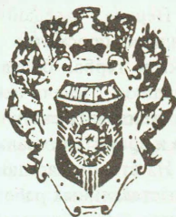
Герб Ангарска 1992 г. (неутвержденный)