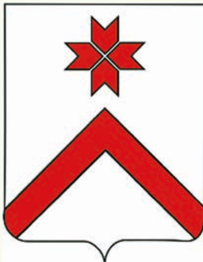
Вариант герба поселка Чамзинка

В качестве своеобразного эксперимента группе студентов факультета истории и права Мордовского государственного педагогического университета имени М. Е. Евсевьева было предложено испытать свои силы в герботворчестве. Проанализировав современное состояние геральдики в Мордовии, участники эксперимента представили серию вариантов гербов для некоторых населенных мест республики. Следует подчеркнуть, что это всего лишь варианты, не претендующие на что-либо большее. Целью данного вида творчества являлась демонстрация еще одной возможности участия общественности в сохранении исторического наследия региона. Немаловажной частью эксперимента была его патриотическая направленность, расцениваемая как бережное отношение к истории Отечества, его культурному наследию, к обычаям и традициям народа 7 .