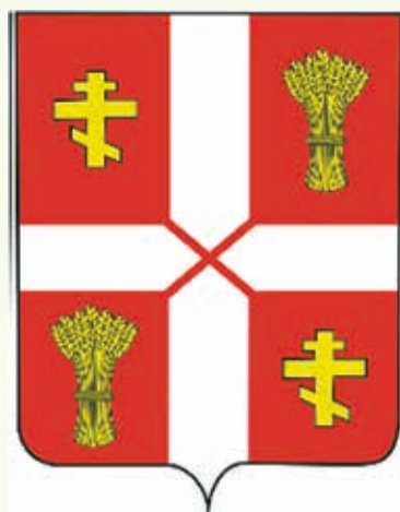
Вариант герба поселка Ромоданово

В данном случае русский крест символизирует возведение в 1913 г. в пос. Ромоданово каменной двухпрестольной церкви (главная — Святого Николая Чудотворца, в приделе — Казанской Божьей Матери) с колокольней. Копна колосьев изображают развитое здесь сельское хозяйство.