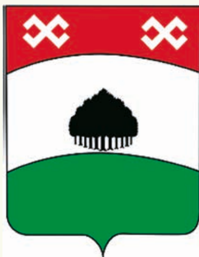
Вариант герба поселка Зубова Поляна

Предложенные варианты гербов отражают как определенные исторические и географические особенности населенных мест, так и элементы этносимволики, возрождение и популяризация которой в последнее время является выраженной тенденцией как в национальной культуре, так и в региональной геральдике 8 .