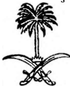
3. Саудовская Аравия

Тем не менее, чтобы разобраться в канонах классической европейской геральдики, нам стоит познакомиться с некоторыми правилами этого ремесла ритуальных услуг.