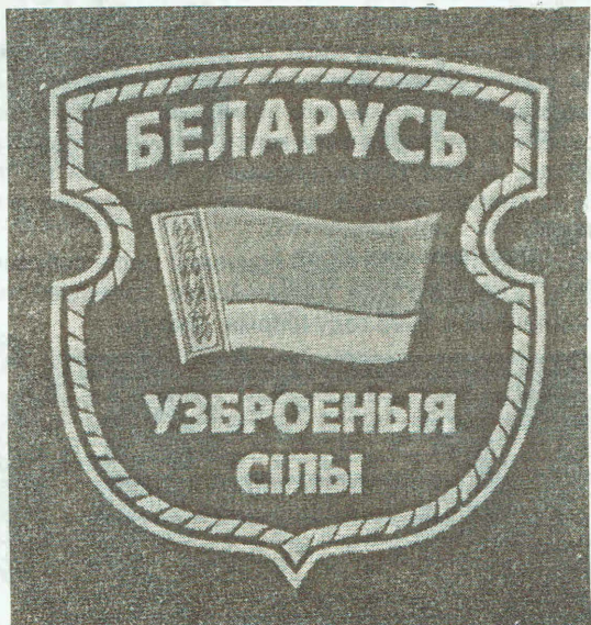
Общий нарукавный знак военнослужащих ВС РБ (на левый рукав)