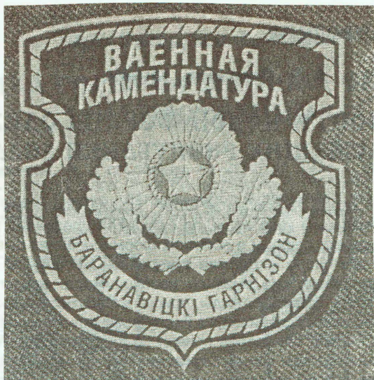
Нарукавный знак военной комендатуры (на правый рукав)