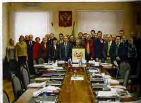
Участники VII слета геральдистов Сибири. В зале заседаний Правительства Республики Хакасия после пленарного заседания. Абакан, 2007 год

Главной целью всех слетов была активизация административного и краеведческого потенциала при создании гербов и флагов муниципальных образований в русле единой государственной политики в области геральдики. До 2001 года ни в одном сибирском регионе не было официальных геральдических комиссий. Одной из задач слета было привлечение общественных геральдических организаций и руководителей в сибирские регионы из европейской части России и Урала, где исторически сложились центры геральдической науки и практики.