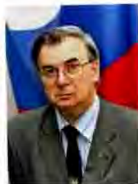
Государственный геральдический мастер РФ Г.В. Вилинбахов

В 2003 году сделан важный шаг в формировании законодательной базы геральдики-правовых отношений. В принятом Федеральном законе «Об общих принципах организации местного самоуправления в Российской Федерации» от 06.10.2003 г. №131-ФЗ в статье 9 «Официальные символы муниципальных образований» закреплена норма обязательной государственной регистрации символов муниципальных образований: