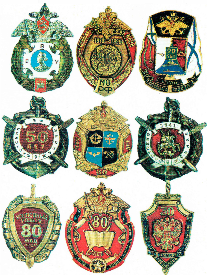
Некоторые образцы нагрудных знаков, изготовленных по рисункам В.К. Рожкова.