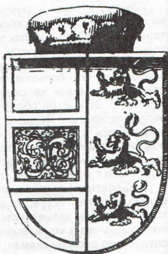
Grb Koroške Герб Каринтии