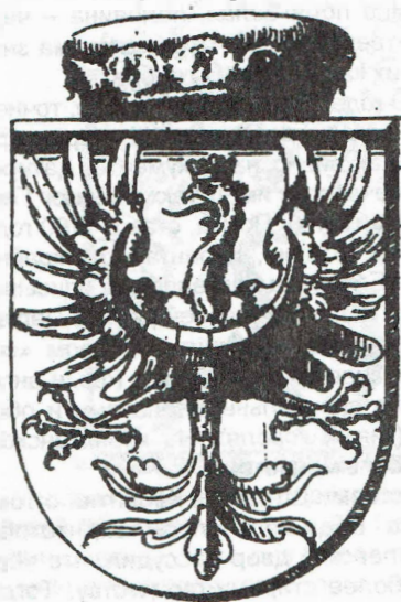
Grb Kranjske Герб Карниолы