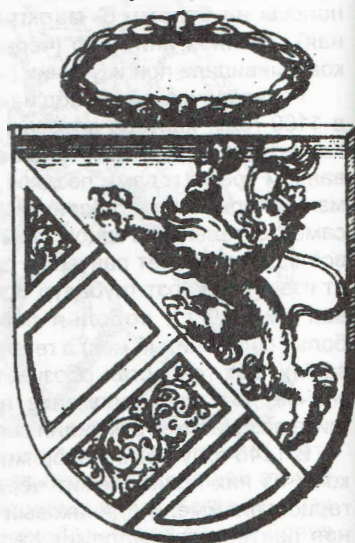
Grb Gorice Герб Горышы