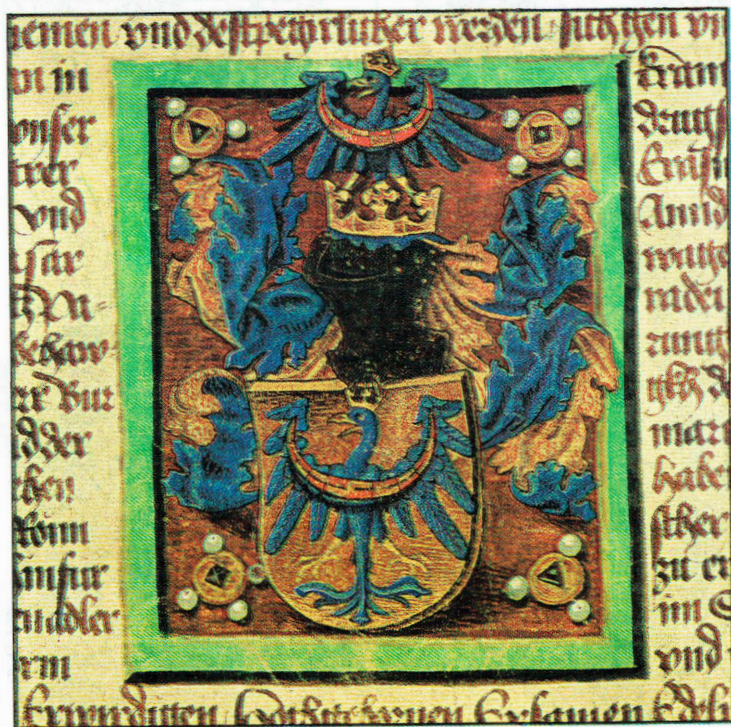
Архивный лист с гербом от 12 января 1463 г. (Архив Республики Словения).